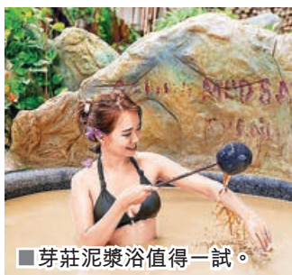
■芽莊泥漿浴值得一試。

龍山寺創立於1889年，在1900年被暴風損毀倒塌，之後才重建。說起來也算是百年的古剎。龍山寺最有名的就是那尊巨大的白色大佛，坐在山頂上非常壯觀。從山腳走上去要爬不少梯級，沿途有各式佛像和壁畫可以慢慢看，走起來不會太辛苦。而登上大佛所在的高台，可以俯瞰芽莊市區，一片綠意和紅瓦屋頂盡收眼底。