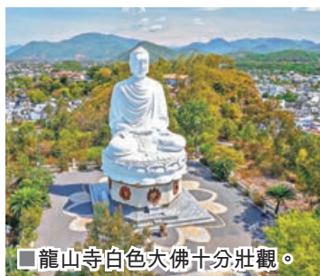
■龍山寺白色大佛十分壯觀。