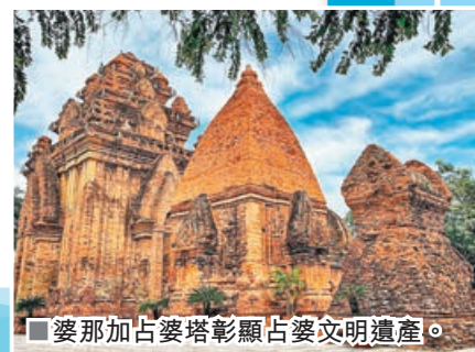
■婆那加占婆塔彰顯占婆文明遺產。

婆那加占婆塔是建於西元8至13世紀的印度教建築，紅磚古塔極具異國風情。它是古代占婆王國建築、宗教的象徵。婆那加占婆塔是整個占婆塔群的通稱，坐落在俯瞰Cai River的山丘上，距離芽莊市中心僅2公里。1979年被越南文化新聞部認定為國家歷史古蹟，該地點仍然是重要的朝聖和旅遊地，彰顯占婆文明遺產。