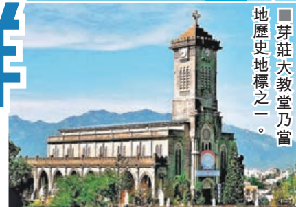
■芽莊大教堂乃當地歷史地標之一。

芽莊泥浴是當地最具特色的招牌水療項目。富含礦物質的天然火山礦泥能有效煥活肌膚、減輕壓力。遊客通常在專業園區內享受20至30分鐘的泥漿浸泡，隨後洗淨並體驗溫泉與水力按摩。芽莊的礦物泥浴非常有名，如著名的I-Resort或Thap Ba溫泉中心，裹頭使用的礦物泥，富含礦物質，能深度放鬆。