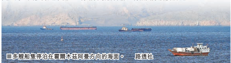
■多艘船隻停泊在霍爾木茲阿曼方向的海面。

霍爾木茲海峽衝突再起。美方於中東時間7月8日凌晨宣布，對伊朗沿海目標發動新一輪空襲，命中逾80個目標，宣稱是回應伊朗日前在霍爾木茲海峽附近襲擊船隻的行為。美國總統特朗普同日稍後更宣稱，他認為美伊達成的諒解備忘錄「已終結」。伊朗當局證實革命衛隊一名士兵在敵軍無人機襲擊中死亡，伊方已展開報復，襲擊85個美軍目標，伊朗總統佩澤希齊揚當日緊急從伊拉克回國應對。美伊衝突升級加上特朗普最新言論，刺激國際油價飆漲逾5%。