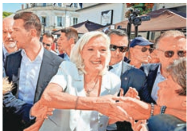
■勒龐(中)往法國中西部城市拉弗萊什，參加競選集會。

現年56歲的勒龐此前已三度競逐總統，曾於2017年及2022年兩度敗給現任總統馬克龍。如今距離明年大選只剩約10個月，她在多項民調中領先。