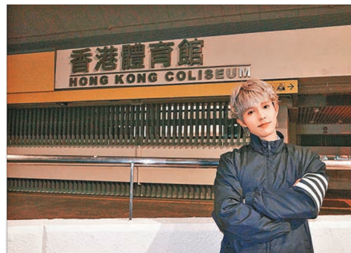
曾經的紅館開騷夢，如今終於實現。