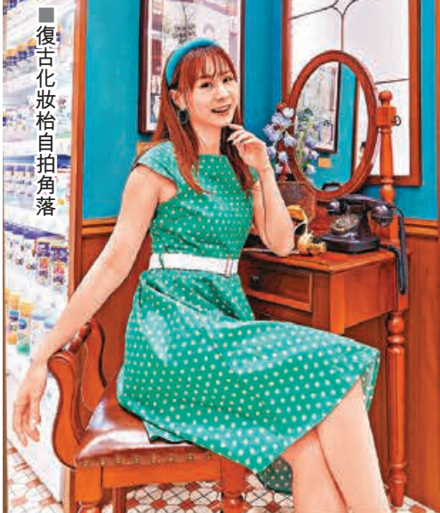
復古化妝枱自拍角落