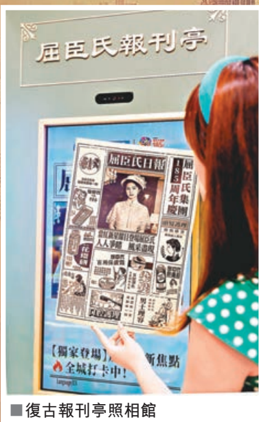
復古報刊亭照相館