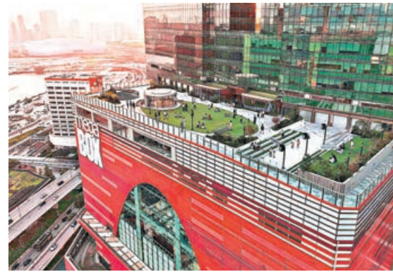
佔地逾 3 萬平方呎的空中花園。

兩大全新打卡點亮相九龍，邀你打卡港風光，留住港回憶。屈臣氏 185周年經典復刻店在油麻地重現舊時大藥房風貌，木製百子櫃、復古化妝枱、懷舊浴室場景，還可以免費拍照並生成「專屬報章頭條」，一秒穿越百年時光，重溫「舊香港」。而九龍灣 MegaBox 則於頂層 18樓打造全透視落地玻璃設計的空中花園，270度飽覽維港壯麗天際線，看盡香港日夜景色的變幻無窮，每晚更會上演絢麗的光影匯演。快約上親朋好友出發打卡，留住港式回憶。