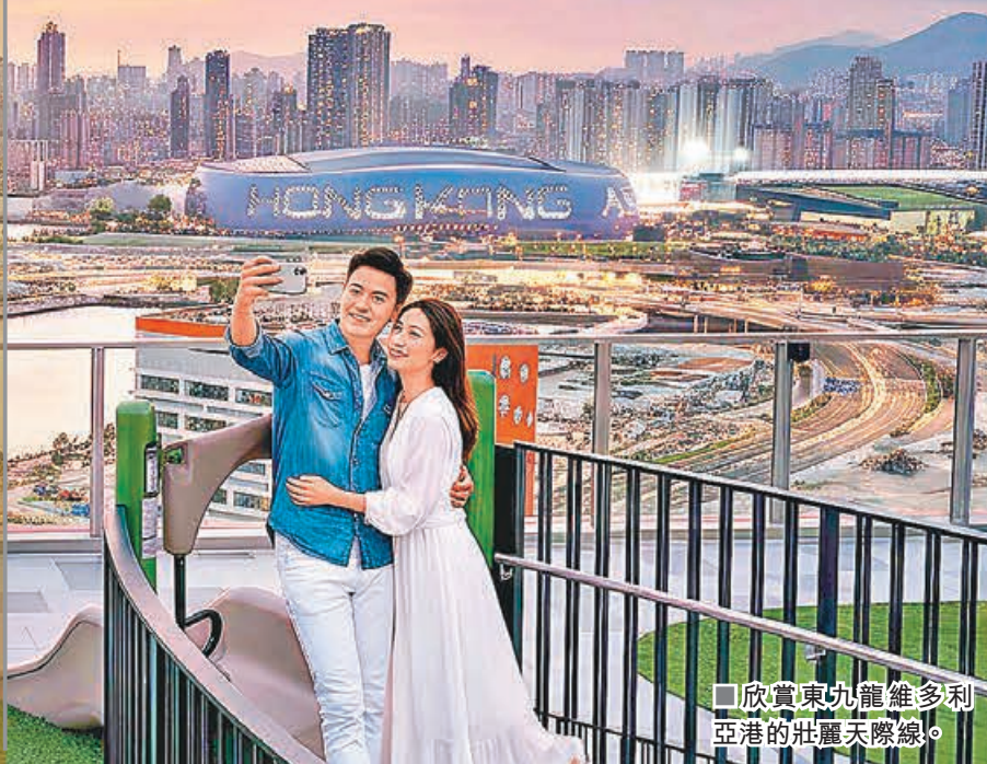
欣賞東九龍維多利亞港的壯麗天際線。