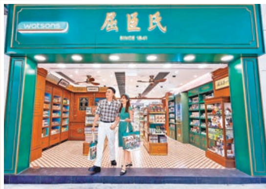
屈臣氏 185周年經典復刻店

兩大全新打卡點亮相九龍，邀你打卡港風光，留住港回憶。屈臣氏 185周年經典復刻店在油麻地重現舊時大藥房風貌，木製百子櫃、復古化妝枱、懷舊浴室場景，還可以免費拍照並生成「專屬報章頭條」，一秒穿越百年時光，重溫「舊香港」。而九龍灣 MegaBox 則於頂層 18樓打造全透視落地玻璃設計的空中花園，270度飽覽維港壯麗天際線，看盡香港日夜景色的變幻無窮，每晚更會上演絢麗的光影匯演。快約上親朋好友出發打卡，留住港式回憶。