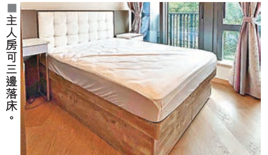
主人房可三邊落床。