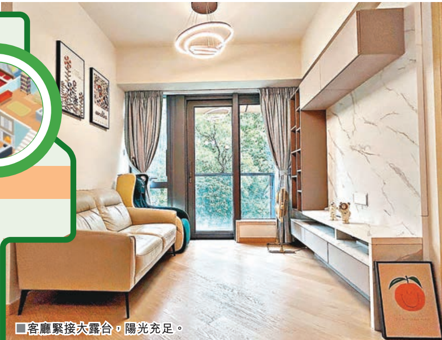
客廳緊接大露台，陽光充足。