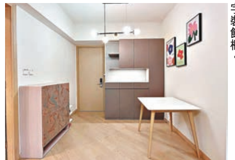
飯廳近大門口設有高身C字裝飾櫃。