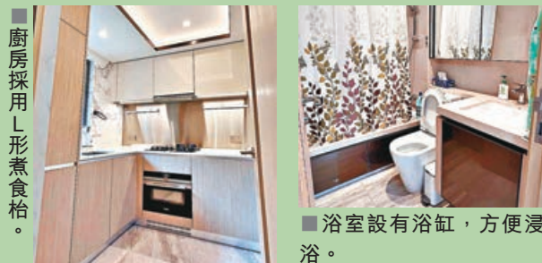
廚房採用L形煮食枱。

中原地產網上資料顯示，大埔天鑽新近錄得9座低層A室二手成交，單位實用面積751平方呎，三房套間隔，日前議價後以933萬元沽出，實用呎價約12,423元。新買家為外區客，見屋苑環境舒適，單位質素高，即決定購入單位自住。