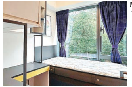
小睡房設有大型玻璃窗戶。