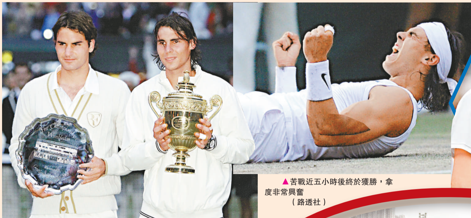
▲苦戰近五小時後終於獲勝，拿度非常興奮