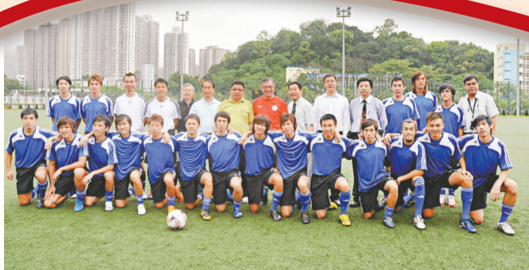
▲大埔獲國際體育用品商提供贊助，今季以全新裝備亮相甲組

另外，足總董事局在本月15日的會議上還討論香港代表隊角逐2011年亞洲杯外圍賽的事宜，梁孔德希望球隊能早日成軍備戰，足總也會在本地賽事檔期上作出遷就。