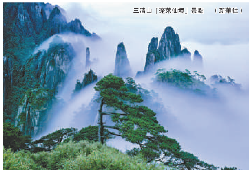
三清山「蓬萊仙境」景點

去年十月，聯合國特派專家在實地考察後，對三清山予以高度評價。之後，三清山又得到了世界自然保護聯盟（IUCN）專家委員會的積極推薦，最終獲通過登錄《世界遺產名錄》。