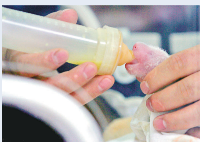
日前，地震後由臥龍轉移至中國保護大熊貓研究中心雅安碧峰峽基地的大熊貓「懶懶」產下雙胞胎，目前該對大熊貓寶寶已可進食。圖為工作人員正對育嬰箱內的雙胞胎老大進行餵食