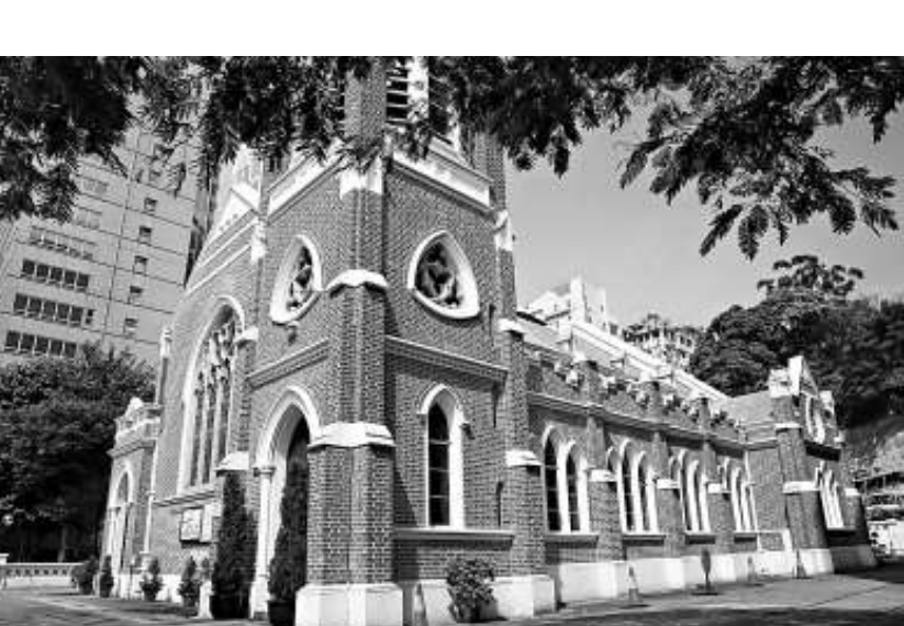
哥特式設計的聖安德烈堂

許多人走過沙咀彌敦道，都不知道九龍公園對面有一座百年教堂，但細心留意，就會發覺前九龍英童學校隔鄰有一座石拱門，拾級而上，在林木掩映間可見一座哥特式建築物，那是聖公會的聖安德烈堂。在這裡竟聽不見汽車噪音，感覺像離開鬧市似的。英國佔領九龍時，尖沙咀是一片荒地，一八八八年底才有定期來往港九的小輪服務。當時聖公會計劃在九龍開設教堂，後來獲得政府撥地，商人遮打捐款三萬五千元，一九〇四年奠基興建聖安德烈堂。與此同時，天主教亦在漆咸道建造九龍玫瑰堂，一九〇五年落成祝聖，但聖安德烈堂卻未能如期完成，結果押後一年至〇六年啟用。