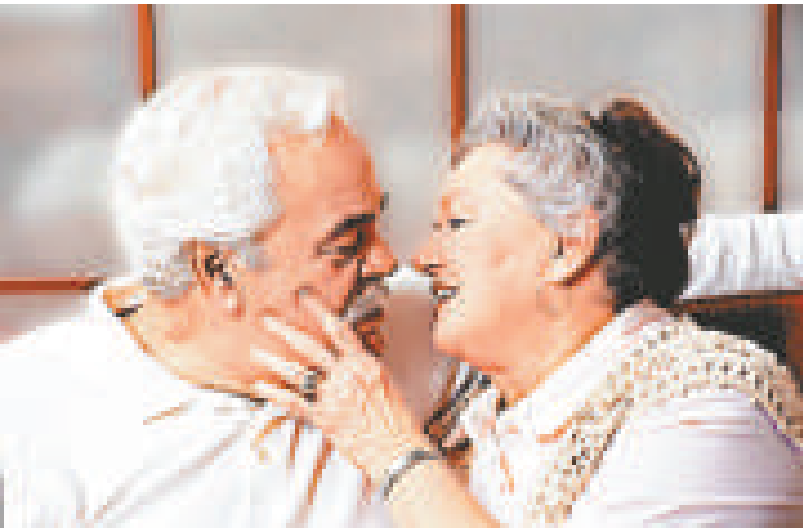
研究指越來越多的七十多歲男女仍有性生活

與一九七一年接受訪問的七十歲女人相比，二〇〇一年接受訪問的七十歲女人的性活動增加了近一倍，而表示「總是有和常常有」高潮的人數亦大幅上升。這表明她們可能因性道德觀念逐漸開放而得益。