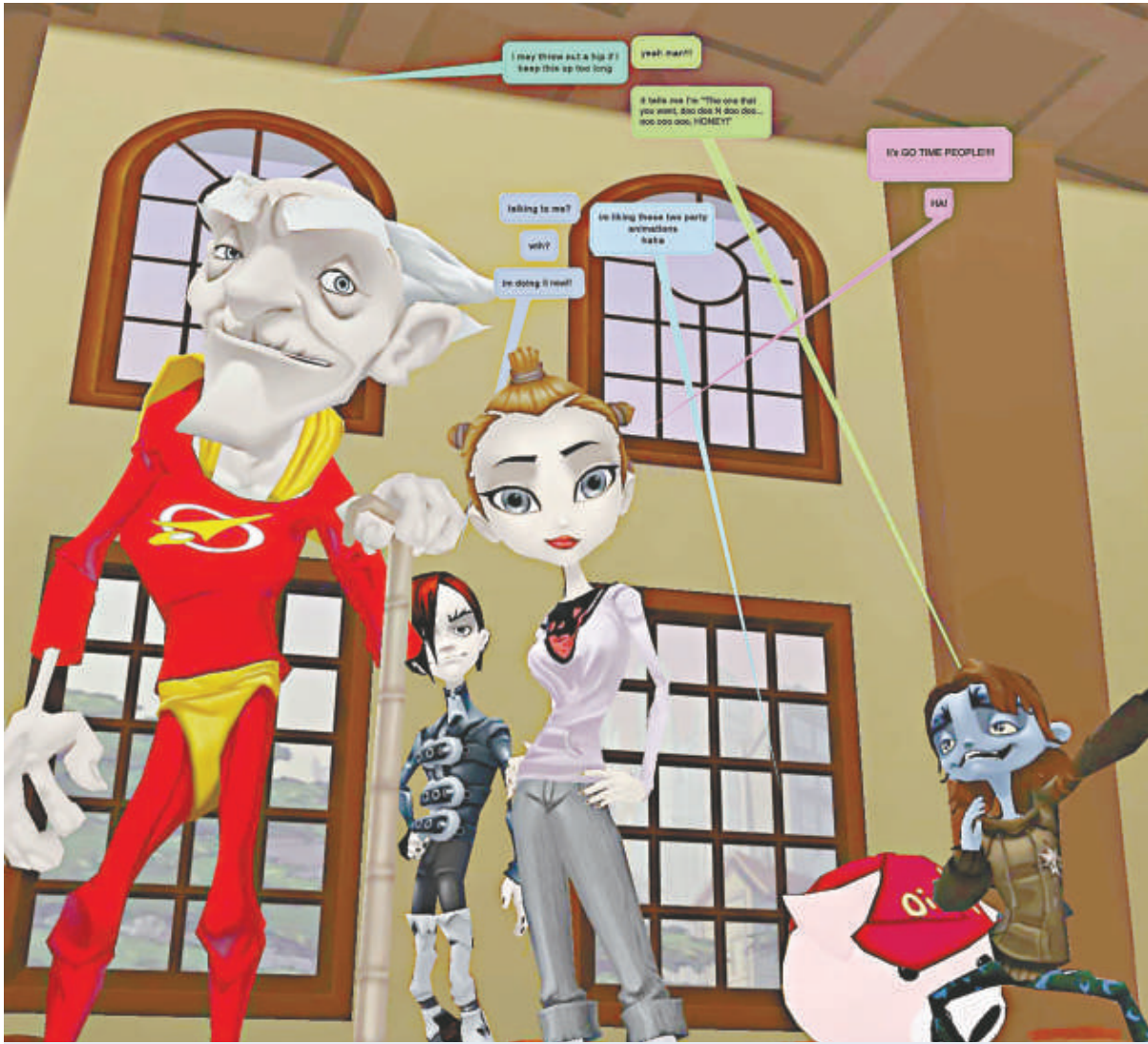
▲ Lively 虛擬社區裡的人物