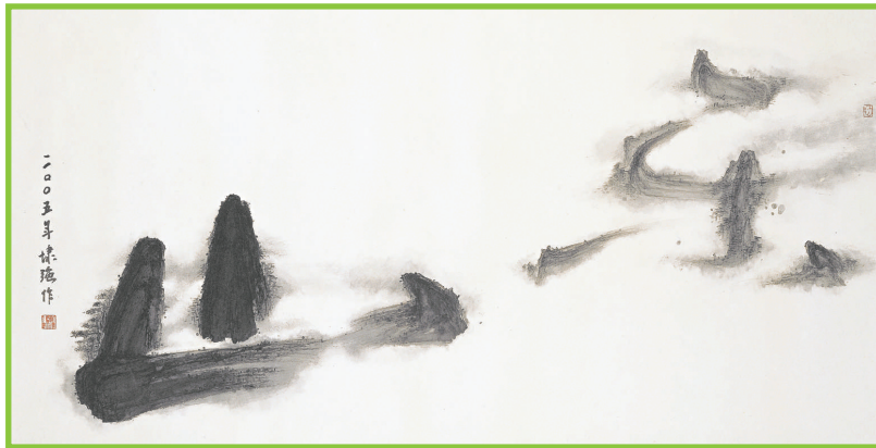
▲靳埭強的水墨作品《仁者》融合書法與山水畫

國際著名設計師、水墨畫家靳埭強的作品，正在新開幕的蘇豪東藝術畫廊展出，「不只水墨——靳埭強個展」包括近年的水墨畫、海報、雕塑等作品，這是該藝術畫廊首個展覽，期望向普羅大眾提供一個欣賞藝術作品的平台。