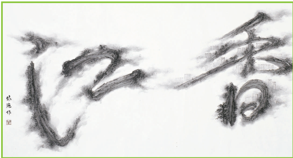
▲水墨作品《香江》，筆劃之間藏山、樹與高樓