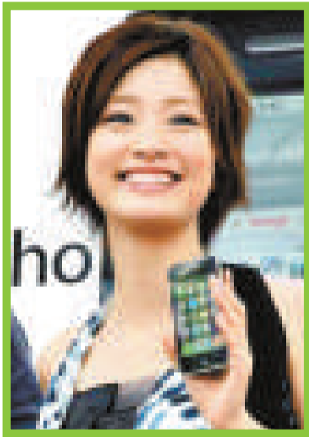
▲上戶彩首次接觸 iPhone，顯得愛不釋手

上戶彩到東京一家大型電器店宣傳，並為發售儀式作倒數。第一次看到 iPhone 的上戶彩，由孫正義的介紹下接觸這部新世代手機的功能，她更興奮地反拍記者，笑言很想擁有一部。由於上戶彩是 Softbank 的代言人，所以她身邊的朋友都叫她想办法弄一部 iPhone 到手，但她表示手機十分渴市，即使身份特殊也不能輕易擁有，只能望着孫正義手上的 iPhone 望梅止渴。