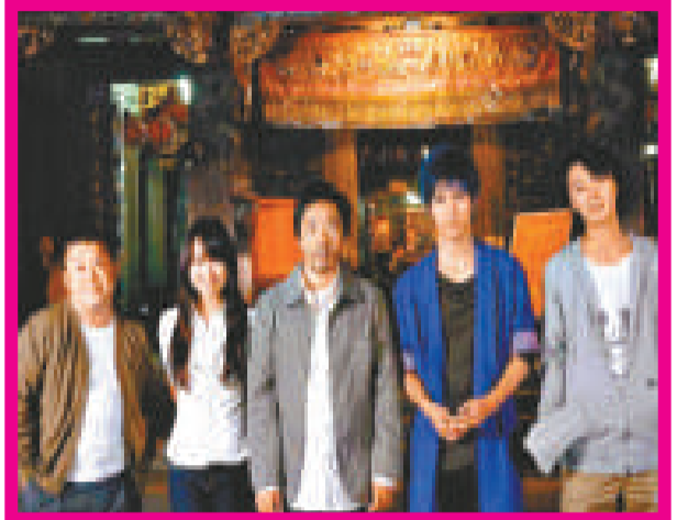
▲《鬪茶》集合了日本和台灣的精英拍攝 ▼香川照之（右）與戶田惠梨香在戲中飾演父女

至於在戲中與戶田有不少對手戲的「仔仔」，在接受日本傳媒的訪問，他稱讚香川是個專業演員，很會照顧身邊的人，是個值得學習的榜樣；而戶田則十分聰穎，理解力和演技都甚佳，戲稱自己十九歲時，完全及不上對方。「仔仔」在日本頗受歡迎，其主演港產片《蝴蝶飛》亦會在秋天於日本上映，而台版「F4」更會在十月到日本作首次公演，相信《鬪茶》亦有助他開拓日本市場。