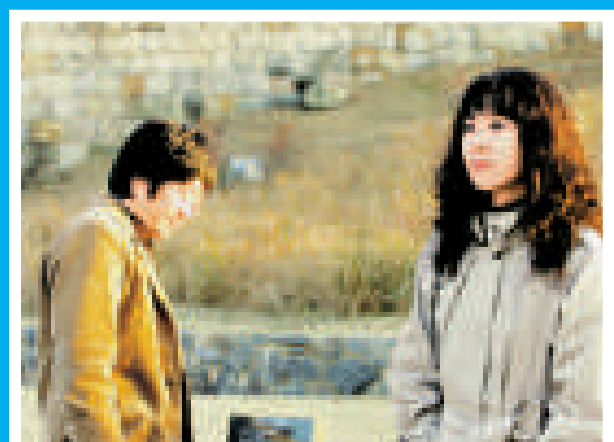
柳承範（左）和孔孝珍在二〇〇一年拍劇後相戀

今年年初復合的柳承範和孔孝珍，最近宣布將在十月十日結婚，而現時兩人正忙於籌備婚禮事宜。柳承範和孔孝珍於二〇〇一年因合演 SBS 劇集《華麗的季節》而認識，拍拖一年後分手，但仍保持着朋友關係，今年初兩人更再度復合，成為韓國演藝圈的熱門話題。