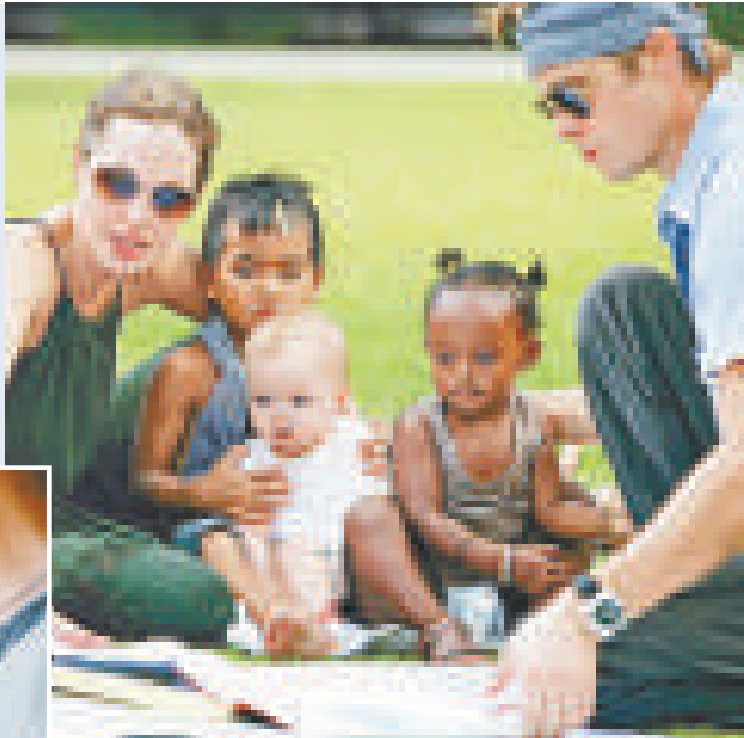
▲兩夫婦和衆多子女組成了多元文化的大家庭