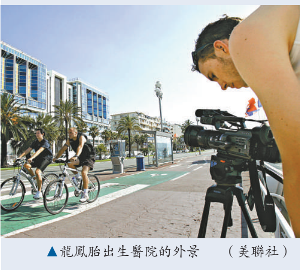
▲龍鳳胎出生醫院的外景