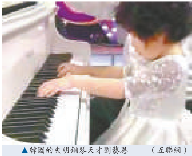
▲韓國的失明鋼琴天才劉藝恩（互聯網）