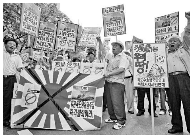
韓國民眾在首爾街頭強烈抗議日本對教科書的修改行為

由於日本政府十四日在初中新學習指導綱要指導手冊中，首度將日韓之間存有爭議的「竹島」列為日本領土，韓國駐日大使權哲賢十五日上午向日本外務次官鄭中三十二正式表達強烈抗議及遺憾之意。他在與鄭中會談後告訴媒體記