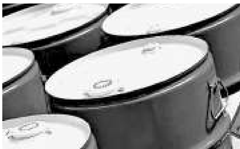
布希十四日解除了在美國近海開採石油的行政禁令

【本報訊】綜合外電華盛頓十四日消息：美國總統布希十四日表示，為應付國際油價飆漲，他已經解除在美國近海開採石油的行政禁令，他同時敦促國會採取類似措施廢除相關開採法律禁令。