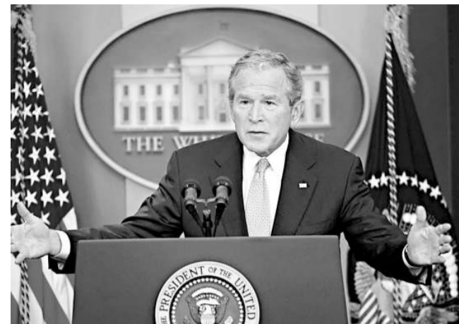
美國總統布希也呼籲國會迅速採取行動實施一項立法，以幫助按揭巨頭房利美和房地美