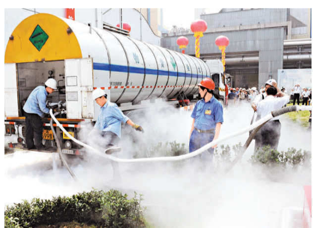
中國首個燃煤電廠二氧化碳捕集示範工程16日成功投產。圖為工人們將二氧化碳充裝到運輸車輛後停車泄壓，現場瀰漫一片白霧。（新華社）

同時，因政府南遷而帶動南部新區去年成交地塊的樓面價推漲至每平方米7000元以上的客觀效應也可能得到控制。房地產業內人士表示，該區域的一些高檔住宅銷售可能將受阻。