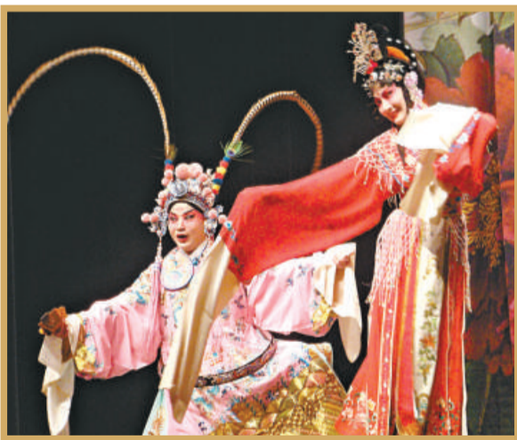
徽劇《小宴》描寫呂布戲貂蟬

康樂及文化事務署將會在七月至九月透過「中國地方戲曲選」，先後舉行徽劇、揚劇及紹劇的演出。這三個分別來自安徽、江蘇和浙江的劇種，都是顯赫有名，各有魅力；可惜限於種種原因，甚少在港演出。