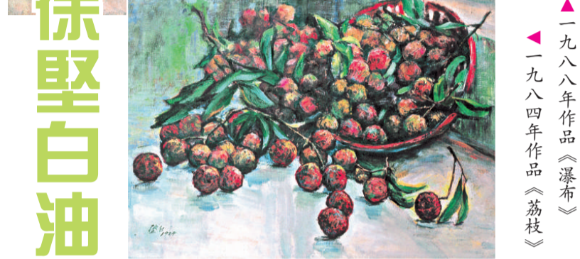
一九八八年作品《瀑布》 一九八四年作品《荔枝》