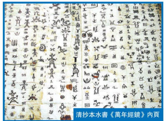
清抄本水書《萬年經鏡》內頁

貴州省古籍保護中心日前在省圖書館正式揭牌成立，貴州省古籍保護階段性成果展覽同期在此舉行，展品中有象形文字「活化石」之稱的「水書」。