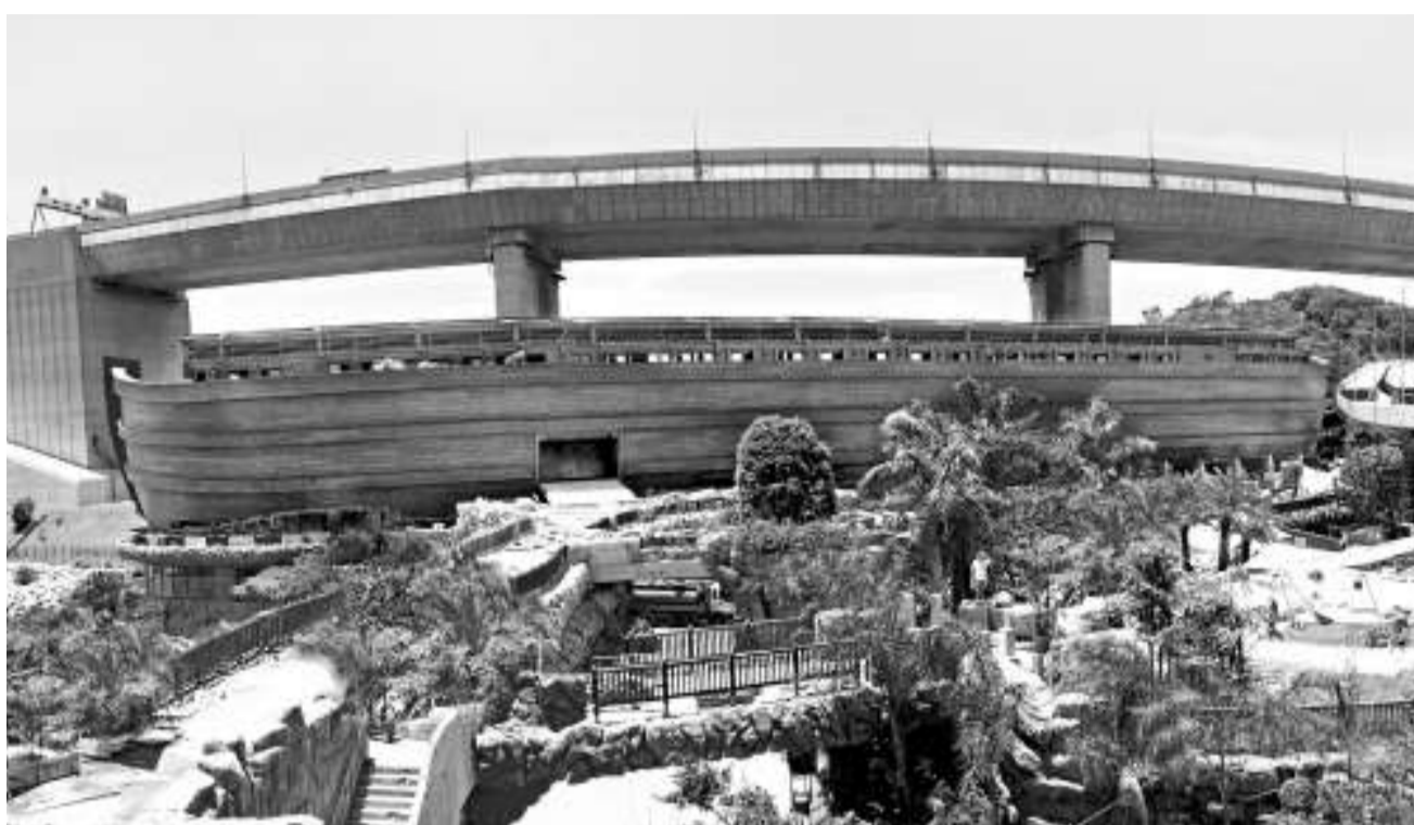
全球唯一原大的挪亞方舟坐落在馬灣公園，新鴻基預計今年年底落成

發展局稱，截至今年六月，馬灣公園第一期建造費大約七億元，累積利息超過四億元。按此計算，新鴻基未付補價