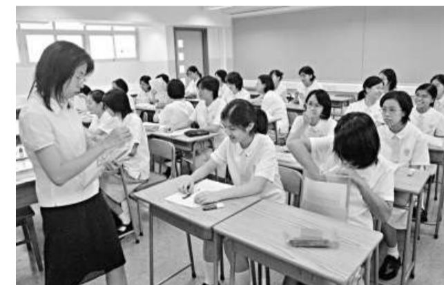
補助學校議會及香港津貼中學議會認為，應讓學校自行決定教學語言

他坦言，倘若不實施微調，到二〇一〇年中中、英中要實行上落車機制，教育界可能承受不起機制帶來的震盪。