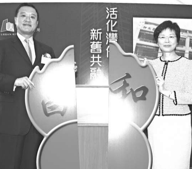
張震遠（左）和林鄭月娥主持和昌大押重建暨保育項目竣工儀式

十二項主要設施，包括展出六十八對動物藝術雕塑的挪亞動物花園、設有戶外大型繩網陣的驚險歷奇樂園、讓住客感受方舟生活的挪亞度假村、舉辦婚禮的彩虹宴會廳、全長超過五百五十米的喜樂單車徑、設有3D視覺科技及一百八十度環迴立體影院的多媒體展覽館、舉行以方舟為題的話劇的表演展覽廳等。