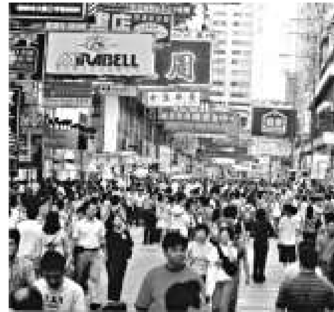
本港就業情況理想，但建造業及保險業失業率明顯上升