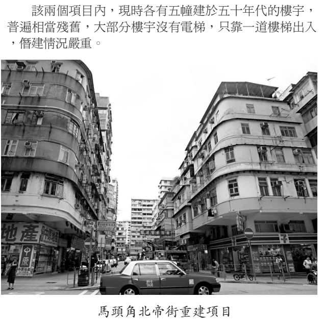
馬頭角北帝街重建項目

【本報訊】市區重建局在馬頭角首批推行的兩個重建項目，浙江街／下鄉道項目及北帝街／木廠街項目，昨日刊憲正式推行。市建局表示，預計在數個月內，向一百二十一個受影響業權的業主提出收購價。市建局表示，今年二月宣布實施該兩個項目後，隨即展開為期兩個月的公眾諮詢，期間市建局無收到任何反對意見。市建局於是在六月五日，按照市區重建局條例的規定，將該發展項目呈交發展局局長考慮，發展局局長已授權市建局着手進行該兩項目，並於昨日出版的政府憲報上，刊載有關決定。北帝街／木廠街項目佔地七百七十六平方米，浙江街／下鄉道項目佔地九百二十八平方米，現時各有五幢建於五十年代的樓宇，涉及一百二十一個業主。市建局會在數個月內，向業主提出建議，並在收購完成後，向合資格的租戶提出現金補償或安置。市建局初步建議，兩項目在二〇一四至二〇一五年完成後，合共提供約二百一十個住宅單位，商用樓面大約二萬七千六百平方呎。市建局二月宣布項目時估計，整個項目的發展成本約為八億六千萬，收購補償開支約為四億七千萬。