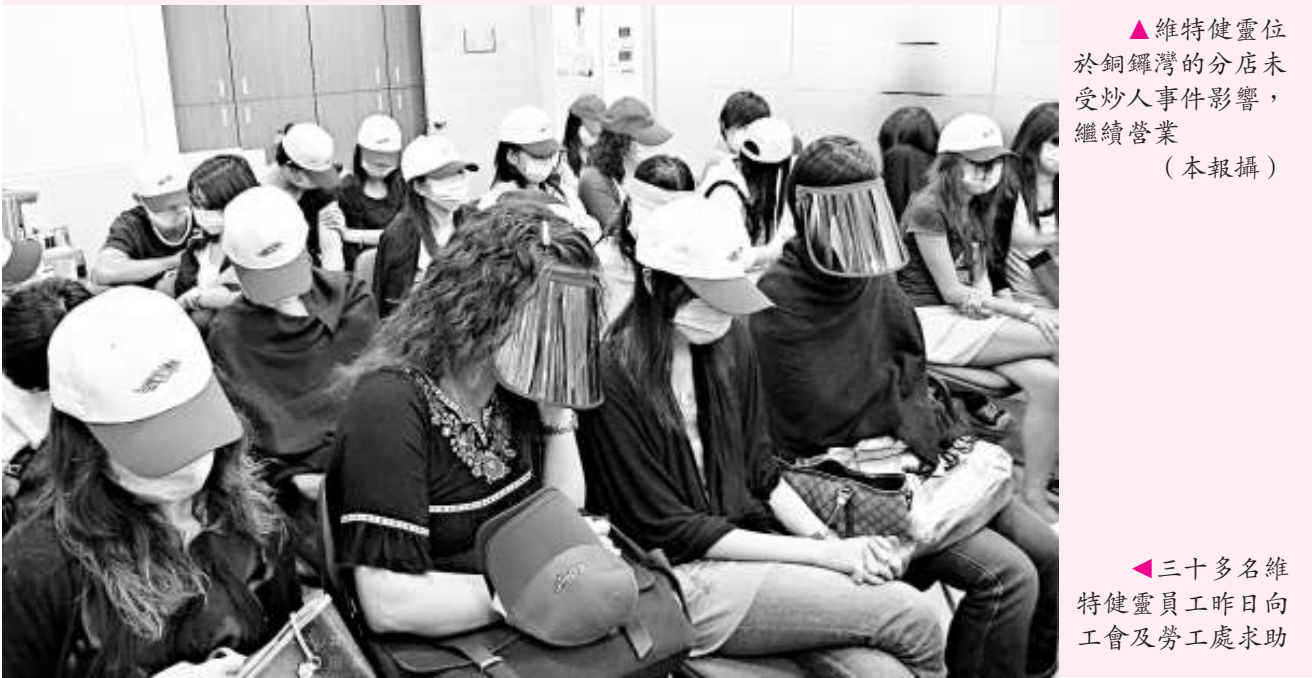
▲維特健靈位於銅鑼灣的分店未受炒人事事件影響，繼續營業