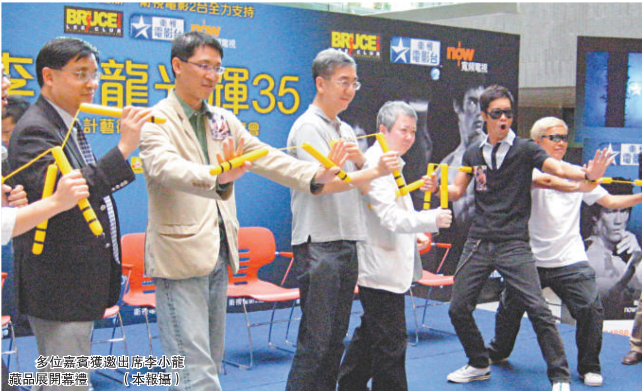
多位嘉賓獲邀出席李小龍藏品展開幕禮

此次展覽會將持續十日，入場費用三十元。香港著名作家、傳媒工作者陶傑，著名導演文雋以及演員田啟文等嘉賓也出席開展儀式現場。