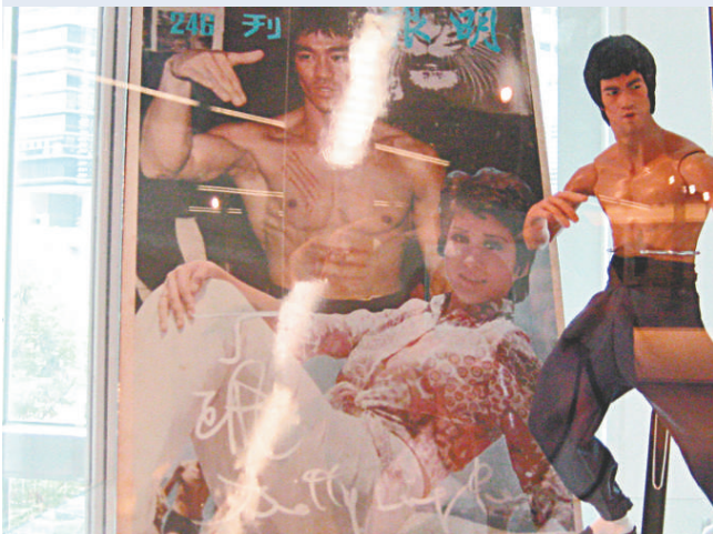
展出的李小龍紀念品