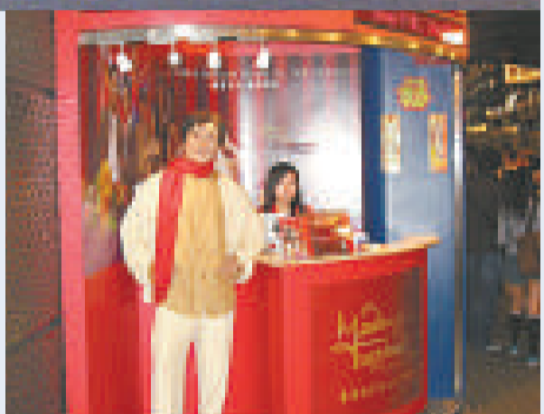
▲一家四口參觀倫敦杜莎夫人蠟像館的入場費總共是八十五英鎊，而在香港的入場費只需二十七英鎊