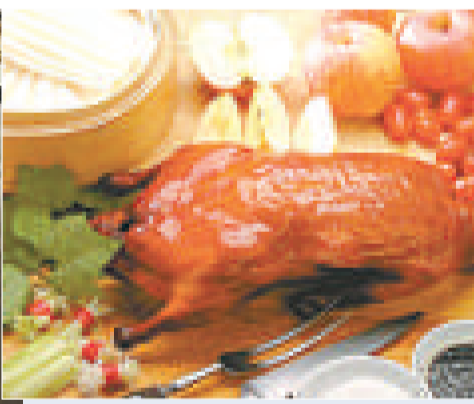
官員稱這種烤鴨爐不符合歐盟訂立的一氧化碳排放安全標準

在倫敦，至今已有一十間餐館受到影響，部分位於唐人街，預料未來數周陸續會有更多的餐館遭封爐。當局亦敦促英國其他地方議會採取打擊措施。