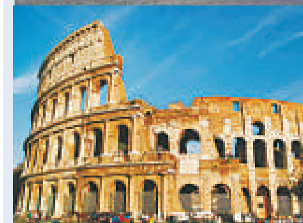
▲調查發現，一家四口參觀倫敦九個著名景點並乘坐觀光巴士，花費高達五百四十九點三英鎊，而在羅馬則只需二百一十六英鎊（互聯網）