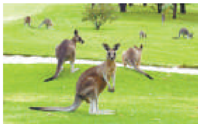
袋鼠在發情期，通常會變得比較暴力

老婦的兒子說，當地居民對袋鼠過多問題已經抱怨了好幾年，但沒有人去管這件事。他擔心其他人也會遭到袋鼠的攻擊。