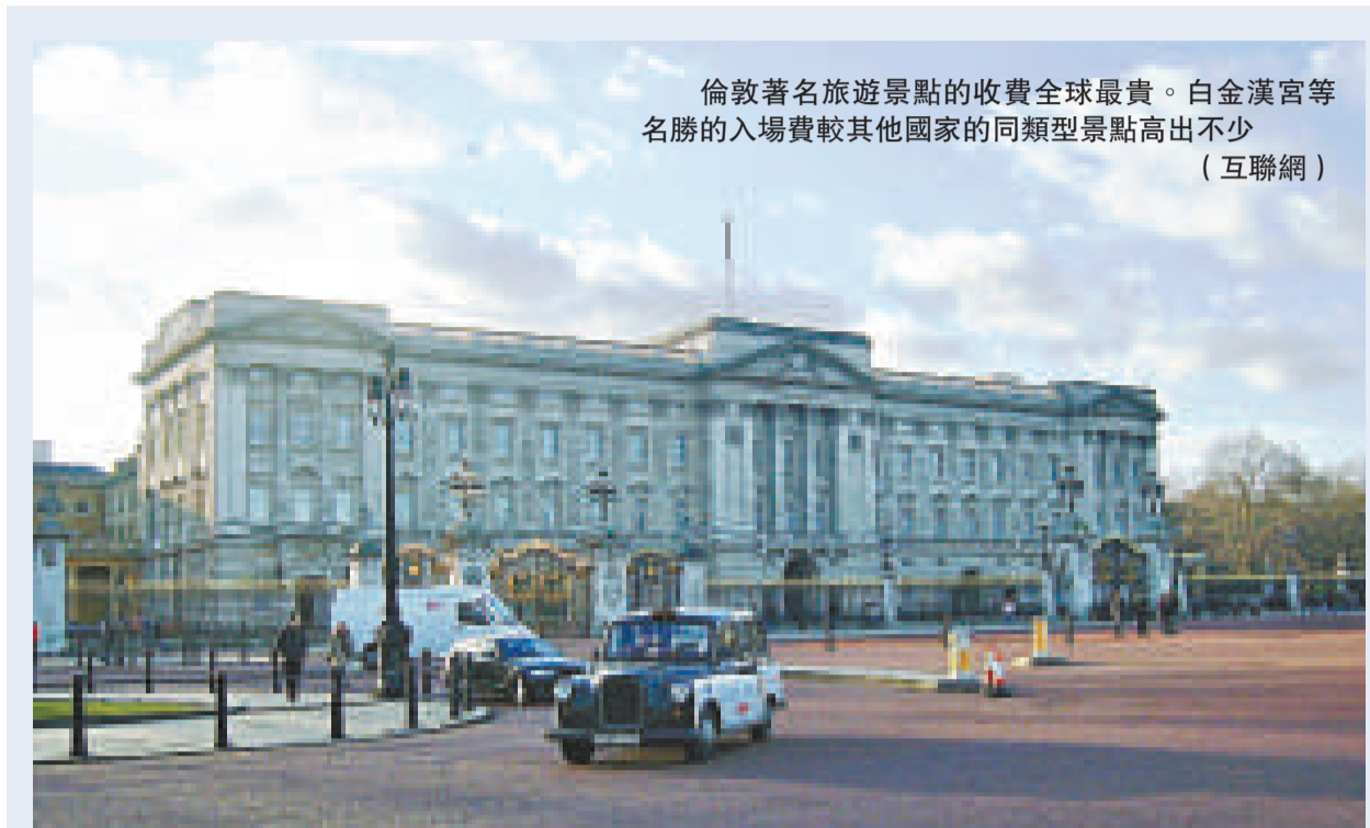
倫敦著名旅遊景點的收費全球最貴。白金漢宮等名勝的入場費較其他國家的同類型景點高出不少

一家四口入場欣賞大英博物館即將舉辦的有關羅馬皇帝哈德良的展覽的話，需要繳付二十五英鎊，收費比巴黎的藝術館高得多，羅浮宮和龐貝度中心等都容許十八歲以下人士免費入場欣賞它的常設展品和專題展覽。龐貝度中心的劃一收費是十二歐元（九點五英鎊），費用包括參觀常設展品和專題展覽。