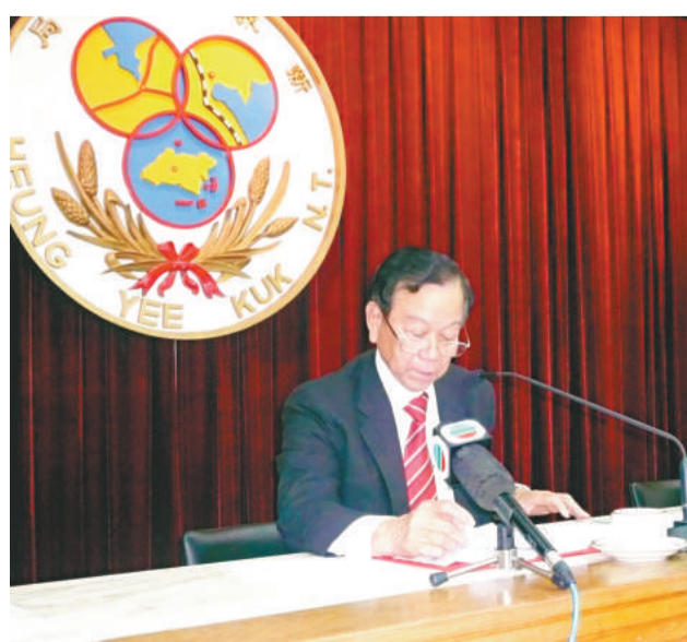
▲劉皇發希望說服鄉議局眾人支持他欲放棄連任區議會界別的意向

【本報訊】關於區議會、鄉議局功能組別的人選爭議，鄉議局主席劉皇發昨日表示，過去自己在區議會的政綱已大部分兌現，問心無愧，未來的工作任重道遠，希望以大局為重，構建和諧社會；他個人想宣布放棄在區議會界別爭取連任，但不排除鄉議局中有興趣人士想為社會服務。鄉議局明日將召開特別會議，決定選舉最終安排。