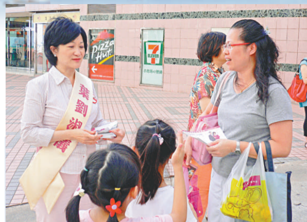
▲葉劉淑儀派傳單宣傳政綱時亦不忘趁機會了解居民訴求