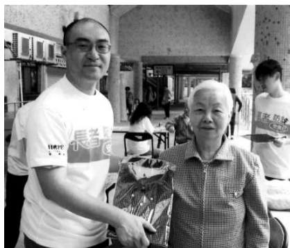
▲寰宇希望的義工贈送衣物予長者

善用集團的資源，以支持社會上有需要人士及慈善機構。金利來集團希望透過捐贈衣物的行動能幫助社會上有需要的人士，同時亦為社會帶出多一份關愛互助的文化，樹立良好企業的典範。