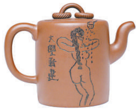
美人壺 一壺道人製作的「雙環

仔細觀察，「如意壺」的壺鈕宛如一條潛藏在壺內的游龍不小心露出了身體的一部分，而「吉祥壺」的壺鈕則似一鸞鳳尾，翹然立於壺蓋之上。既是「吉祥如意」，也是「龍鳳呈祥」，整體看來「龍」中呈「鳳」、「鳳」中藏「龍」——「如意壺」剛正的黑料中不乏柔美，「吉祥壺」圓潤的弧度間也不失英氣，你中有我，我中有你，呈現一派和諧、美滿、甜蜜的氣氛，寓意堅貞、相守，蘊含人間愛情，更寄託一份夙願。