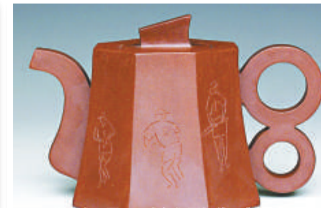
紫砂壺「風」，壺鈕塑風帆狀，寓意一帆風順

一壺道人說，茶壺名為「雙環美人」，實有洗去一身塵埃，追求美好愛情之意。把玩時，雙環可旋轉，聞紫玉之聲，清脆悅耳。泥為清水泥，色澤溫潤，沖泡紅茶為宜。