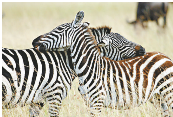
黃建忠作品《原野上有你相伴，已經足夠》獲「最觸動人心獎」