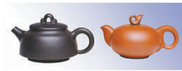
▲「吉祥如意壺」 ▲「山裡人家」，壺身透山林野趣，古樸雅氣

壺的文化氣息，更加深了整個紫砂歷史的內涵。這種參與承載了書畫藝術，改寫了紫砂的文化歷史。