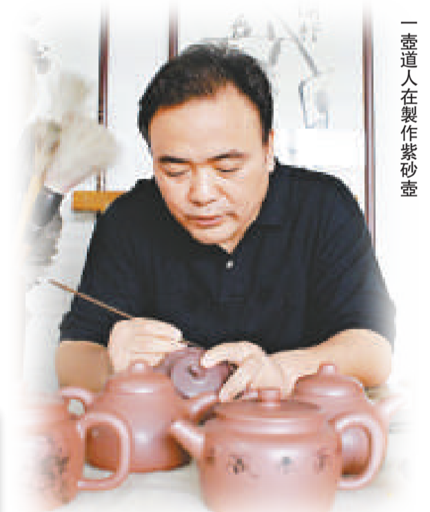
一壺道人在製作紫砂壺

泥中的清水泥，此泥為宜興趙莊深井開採，泥色醇和雅雅，文人氣息濃厚，為明初陶手最喜用的泥料之一。「吉祥壺」的主體壺身表現出的是美麗女子的豐滿誘人，將美麗女子的可人形象濃縮在其身體的某個特質上，圓融挺滿，令人愛不忍釋，再加之與純正清水泥料的搭配，質感豐潤，嬌嫩欲滴。壺蓋與壺身儼然一體，曲線流暢適度，委婉動人。壺鈕以「祥雲」向上的原形體現出吉祥，壺嘴則以中國古典美女的櫻桃小嘴為狀，微啟欲說，形象生動。