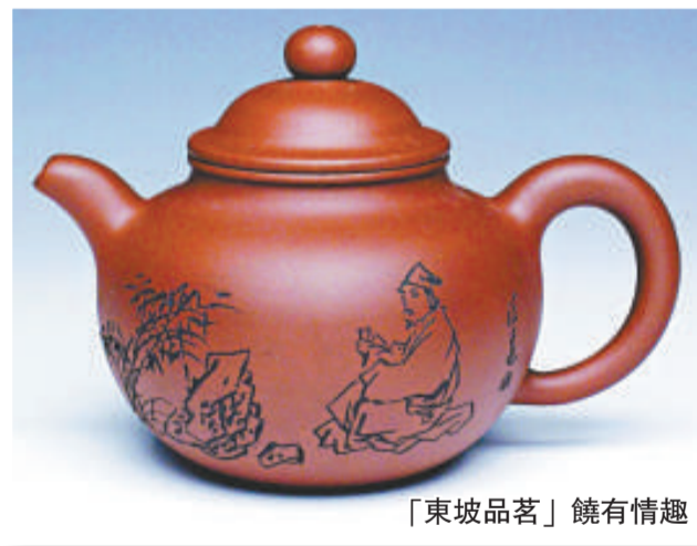
「東坡品茗」饒有情趣

在現代社會，作為商品的紫砂陶器的精神屬性，越來越高於它的物質屬性，紫砂的歷史是有文化人支撐而形成的歷史，紫砂實質上是「文人工藝品」。在江蘇宜興，鍾情紫砂，號為「一壺道人」的石曉良，致力於將當代文人畫在紫砂壺上表現出來，他設計並創作的紫砂壺，既有文人畫的意趣，又顯紫砂壺的古樸醇厚。