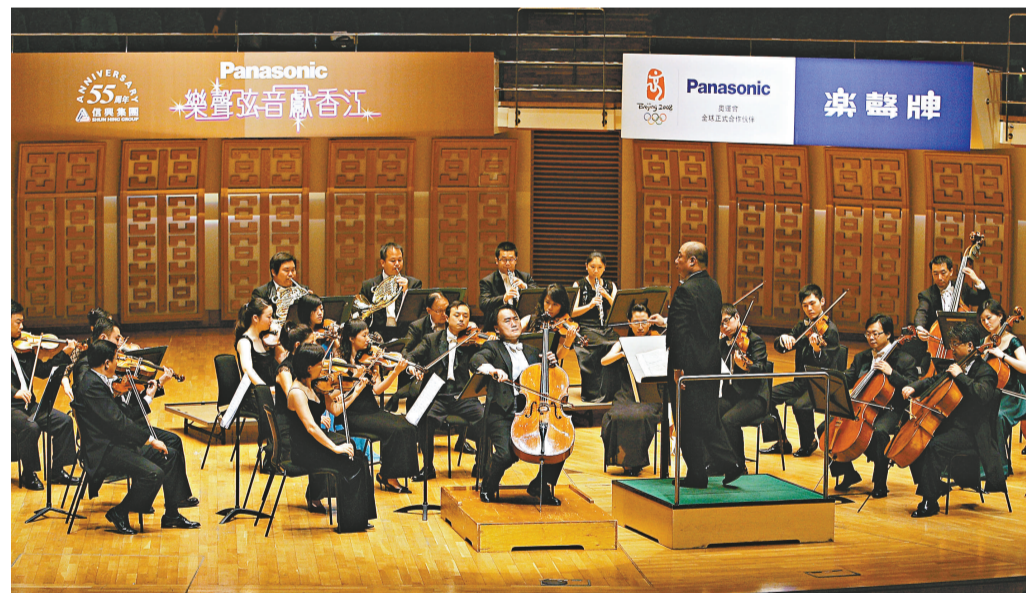
▲上海東方小交響樂團正在演奏