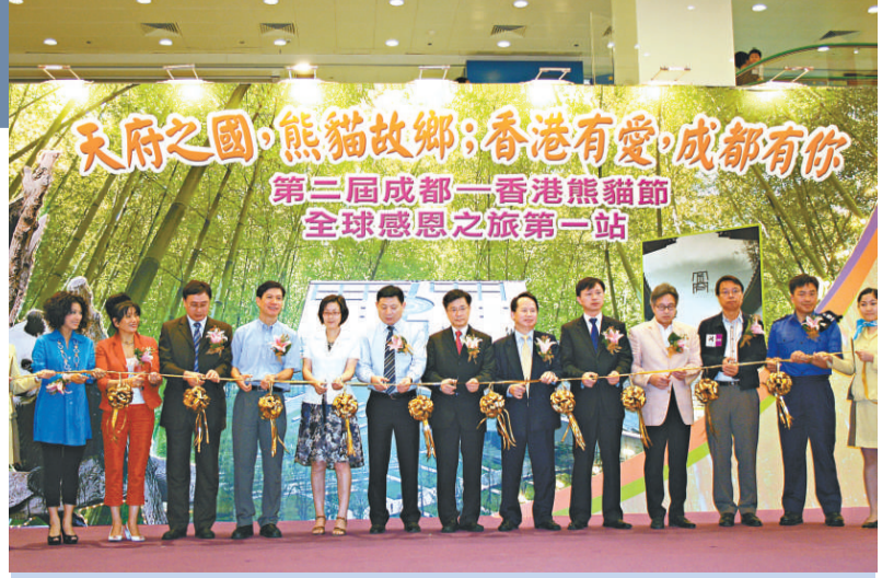
▲參加儀式的賓主為活動剪綵

學鑑，著名導演李力持，著名藝人米雪，以及消防處、衛生署、屯門醫院、紅十字會的代表等。儀式上，成都有關方面的負責人為參與汶川地震救災的香港消防處、醫生和紅十字會的代表頒發了錦旗和紀念品，並對港人在賑災中的無私奉獻表示了衷心的感謝。據成都文化旅遊有關負責人余勇、張藝介紹，第二屆熊貓節的定位是成都全面啓動境外旅遊市場的標誌，以「天府之國，熊貓故鄉；香港有愛，成都有你」為主題，突出「感恩之旅」的主旋律。活動除以各種形式展現成都豐富多彩的旅遊資源外，還力求樹立成都旅遊安全、正面的旅遊形象。在為期兩天的活動環節中，主