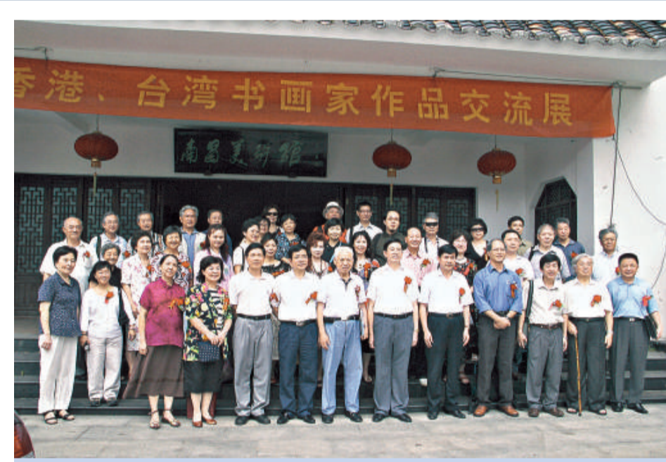
▲江西省人大、省政協及省老年書畫會領導與港台及江西書畫家合影

「信興教育及慈善基金」於1984年成立，本着「取諸社會，用諸社會」的宗旨，熱心支援各類公益慈善活動，迄今捐款已超過5億元，資助多個教育、醫療、體育、文化藝術、科學研究及社會服務等項目。