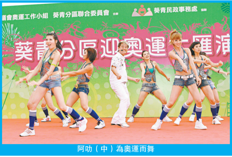
阿叻（中）為奧運而舞