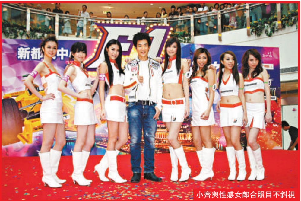
小齊與性感女郎合照目不斜視