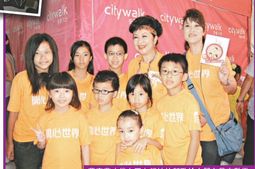
薛家燕（後左四）望她的新歌給小朋友帶來歡樂