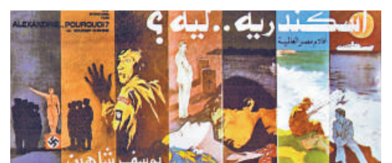
▲沙軒的半自傳系列三部曲之一

沙軒作風敢言，作品經常抨擊政府，一九六九年的《大地》(The Land)就講述地主勾結腐敗的政府，壓迫和欺榨農民。被問及藝術家是否一定要「政治化」時，沙軒說：「如果不知道當代的社會、政治及經濟狀況，根本不算是一個真正的藝術家。如果你的作品談論埃及的人民，你就一定需要知道他們的切身問題。」