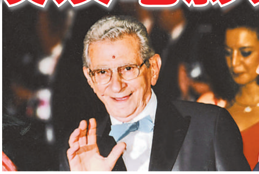
▲尤昔夫沙軒為阿拉伯電影的先驅之一 ▶《差館大佬》為沙軒的遺作 ▼《阿歷山大港——紐約》為沙軒近年的電影作品