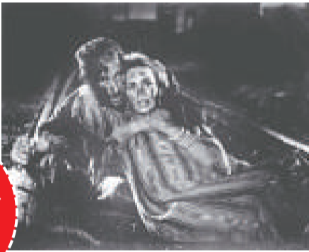
▲《命運》在康城獲得頗高評價