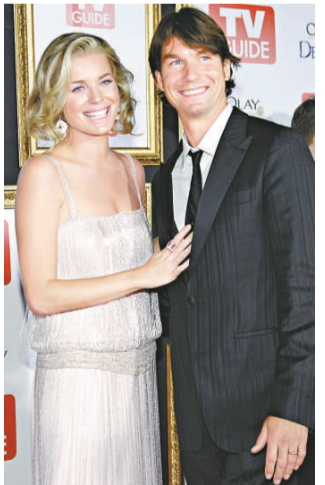
▲奧干納(右)與Romijn快將做父母 ▼法拉娜戀心裝扮，明艷照人

發言人稱，預期待子在今冬出生。奧干納與Romijn於去年七月在洛杉磯結婚，這將是他倆首次做父母。