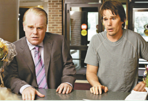
▲電影彰顯人性，容易惹共鳴

薛尼盧密下下的家庭衝突把人性彰顯得淋漓盡致，這對兄弟的連環劫，點止劫珠寶店那麼簡單。