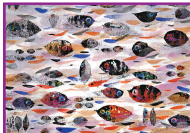
《葉魚》（水墨、綜合媒材）

媒材和方法，再創新的中國水墨畫面貌，他強調，要創造既是個人獨特的風格，又是屬於我們這個年代的中國畫。