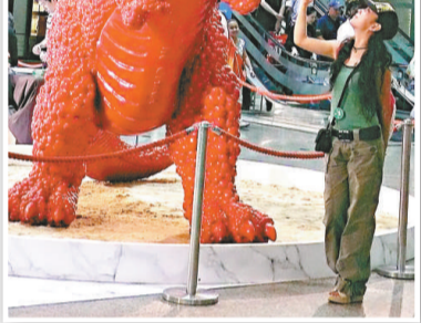
▲女遊客俏皮地和恐龍「拋手爪」

隋建國較早為人熟悉的作品，是「衣鉢——中山裝」，顧名思義，中山裝最早是由孫中山設計出來的，而隋建國創作這系列「衣鉢——中山裝」，卻與香港有關，更是為紀念九七香港回歸而創作。他說：「是九七回歸歸讓我想到這作品，孫中山設計這款服裝，是於十九世紀末，那時香港被劃了出去，而孫中山就是這時期起來革命，解放中國，追求現代化，當時這中山裝被視為非常前衛