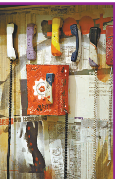
▲《熱線》（水墨、綜合媒材）

除了在傳統水墨畫上有相當造詣，袁金塔還勇於突破傳統限制，喜歡嘗試各種媒材，企圖從中探索更多藝術創作的可能性、可能性，例如他常用舊報紙這類日常生活常見的物品當媒材。他笑着說，藝術應該是生活化的，報紙上原有