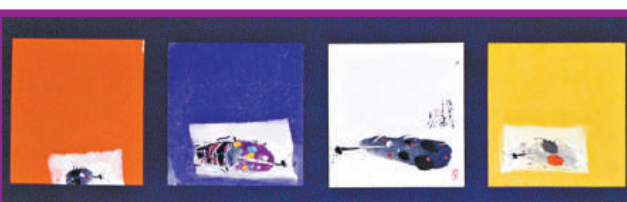
《羽毛蟲蟲》（水墨設色、宣紙）

上海美術館舉行的「生態科技與人文關懷——台灣畫家袁金塔藝術展」至八月三日結束。該展覽預計在日本京都、中國廣州、台灣長流美術館陸續展出。袁金塔也希望透過這系列作品，與熱愛藝術的朋友交流。