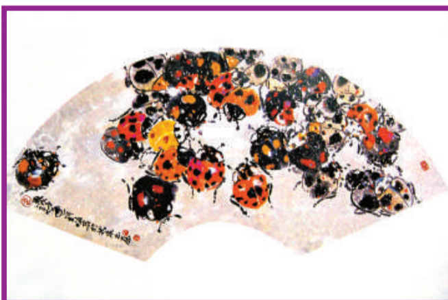
《甲蟲》（水墨、綜合媒材）

記憶，一方面這些記憶就是他生命的一部分，另一層面則是他把過去的記憶拿來與現今的社會情況對比，以藝術的形態轉換成畫筆下的繽紛世界。