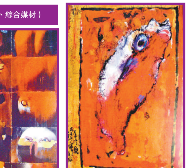
▲《台灣魚》（水墨、綜合媒材）

此外，他還一直致力中國傳統水墨的創新，不斷透過筆墨、壓克力、紙張、陶土、影印、拼貼、傳統雕刻等不同的