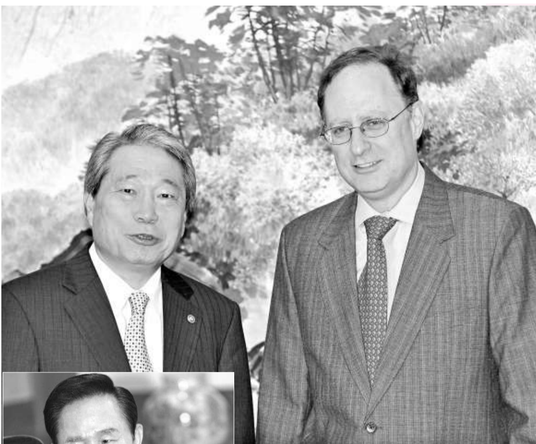
▲美國駐韓大使弗什博（右）會見了韓國外交部長柳明桓，並表示：「希望上周發生的誤會隨著布什總統的發言而塵埃落定。」

位於朝鮮半島東部海域的獨島（竹島）由兩座小島和周邊幾十個島礁組成，總面積僅有零點一八平方公里，歷史上曾長期無人居住。韓日兩國都聲稱對獨島（竹島）擁有主權，但目前該島由韓國實際控制。