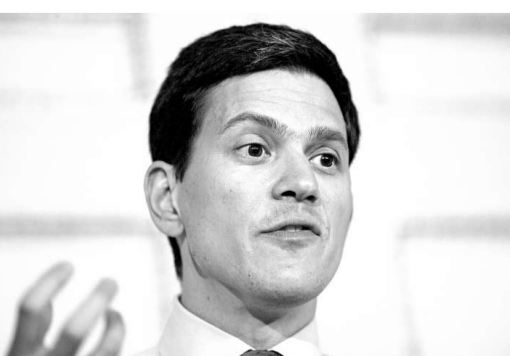
英國一間博彩公司將文禮彬列為接替白高敦的大熱門

英國一間博彩公司將文禮彬列為接替白高敦的大熱門，其次是現任衛生大臣莊翰生，之後是司法大臣兼大法官施仲宏。