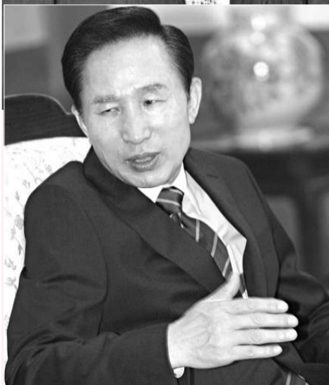
▲分析人士稱，布什希望表明他支持保守派總統李明博的立場