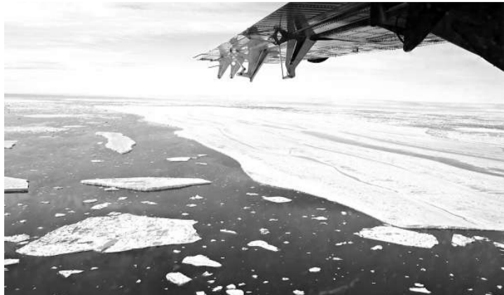
兩大塊面積總共將近二十平方公里的冰層自北極冰架脫離

二零零五年八月發生冰架斷裂事件時，兩百五十公里外加國的地震設施偵測到冰架脫離釋放出的能量，但一直到科學家分析衛星資料時，才了解發生了什麼事。