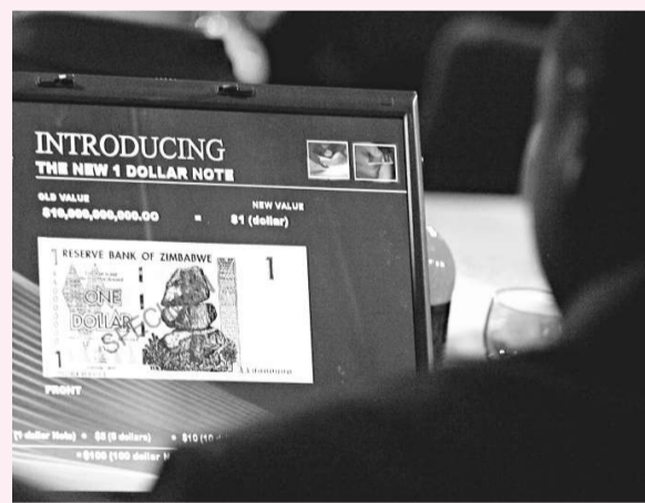
新貨幣一元元相等於原來的一百億津元

據津巴布韋央行日前公布的數據，津通貨膨脹率目前已高達百分之二百二十萬。美元對津元的比價已由年初的一比五千三急劇升值至一比一千二百。