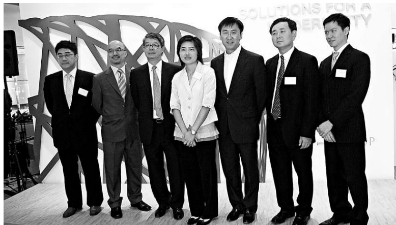
▲這幾位香港建築師通過展覽與本港市民分享參與奧運建設的喜悅