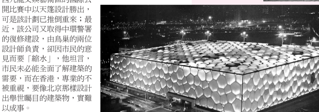
▲現場展出水立方夜景照片