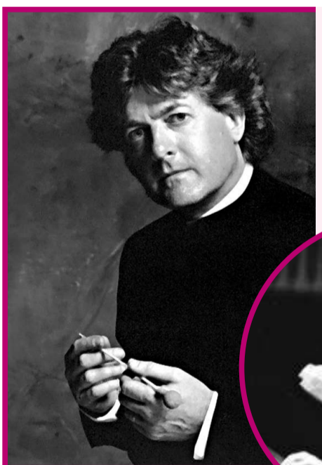
▲「亞青」藝術總監 著名指揮家朱特 將為「亞青」執棒

每年夏天，亞洲青年管弦樂團定必舉行訓練營及巡迴演出，而樂團的音樂會，總是香港音樂界暑假的其中一個重點節目。據悉，今年樂團在七月十四日至七月底舉行訓練營，隨後由八月一日開始，依次在蘇州、南京、香港、東京、深圳及台北演出。