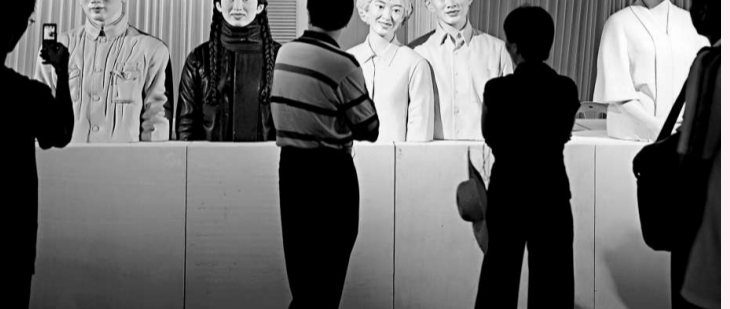
觀衆參觀雕塑展品

【本報訊】記者郝正海廈門報道：「中國姿態·海峽風——首屆中國雕塑大展」，日前在廈門園博苑主展館正式開展。這是建國以來首次用「中國雕塑」命名的雕塑藝術大展，也是中國當代規模最大、參展人數最多、集專業性與學術性於一身的大型雕塑展覽。