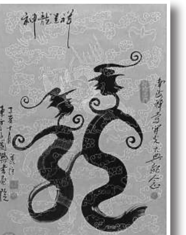
「神龍」書法作品《神龍呈祥》

他說，龍作為中國的象徵，凝聚全球炎黃子孫的愛國之心，希望這幅作品能為即將召開的 2008 北京奧運會助興造勢，表達「龍的傳人」之「我為奧運添光彩」心願，藉此弘揚神龍文化精神內涵。