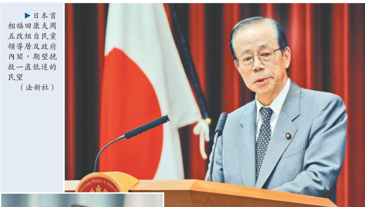
日本首相福田康夫周五改組自民黨領導層及政府內閣，期望挽救一直低迷的民望

有分析認為，新內閣暗示福田將把焦點放在選民最關心的福利和生計問題上。這一點可以從他任命備受歡迎的眾議院女議員野田聖子擔任新的消費者行政大臣一職看出。而新的財務大臣在獲任命後的新聞發布會上表示，政府將在兩三年間考慮是否調升消費稅。