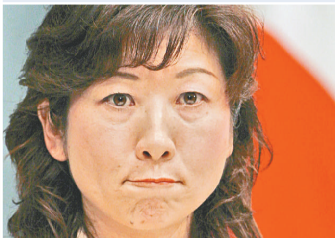
野田聖子擔任消費者行政大臣