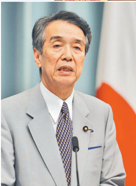
伊吹文明獲任財務大臣