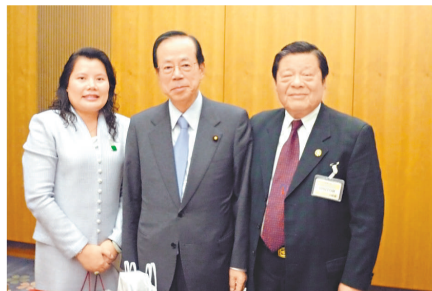
福田首相與湯恩佳院長伉儷談笑甚歡