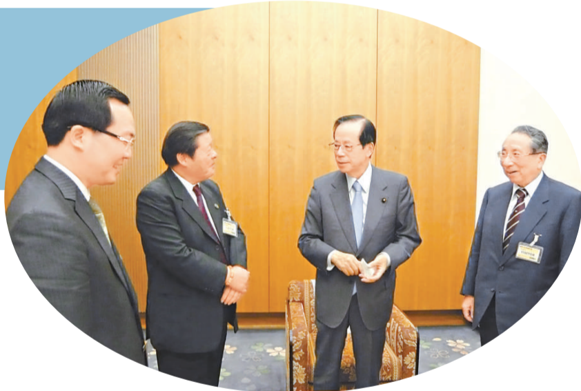
福田首相與西原春夫教授、湯恩佳院長、許智明主席親切交談

孔教經典《論語》在日本的影響之大，出乎人的意料。首相先生小的時候學過《論語》，熟悉《論語》中的許多內容，在參觀曲阜孔廟時隨口說出《論語》中的許多名言。日本高中開設了《論語》課，日本許多書店裡都有孔子專櫃，日本出版的《論語》相關書籍多達568個版本。美國著名史學家賴肖爾說：「公開承認自己是「孔孟之徒」的人幾乎沒有，但在某種意義上來說，幾乎一