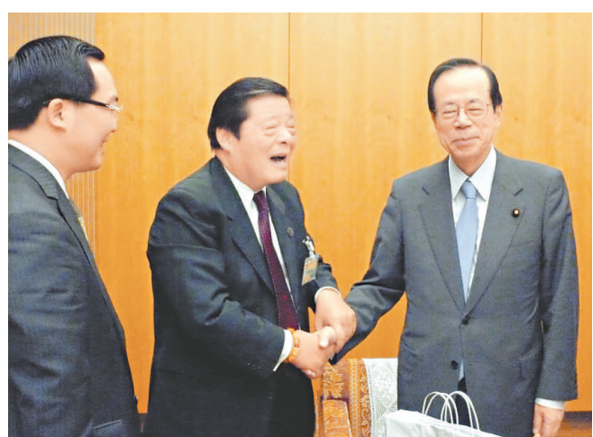
福田首相與湯恩佳院長親切握手

與天地萬物為一體，是仁者的崇高境界。不分彼此，不分你我，不被私利所蒙蔽，以仁愛之心來對待他國人民，遵守孔子「己欲立而立人，己欲達而達人」的思想，以「和為貴」為宗旨，才能真正實現世界和平！