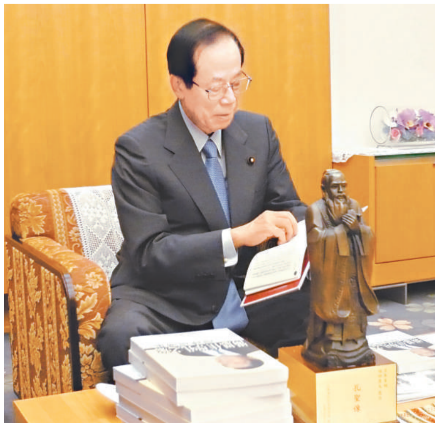
福田首相細心欣賞孔教學院出版之刊物