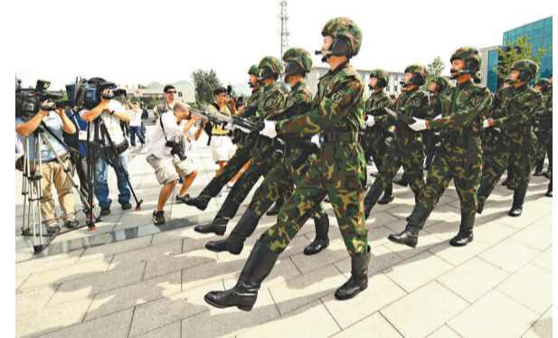
八月一日，記者拍攝裝甲六師慶祝「八一」建軍節分列式表演

據了解，裝甲六師1968年9月由坦克兵和炮兵組建，執行保衛北京安全、實施機動作戰的任務。該師編制3個裝甲團、1個自行火炮團、1個防空團，以及作戰支援和作戰保障部隊，共8000餘人。該部隊建軍後參加了歷次國慶閱兵和重大軍事演習，是中國第一支也是唯一的迎外裝甲部隊。