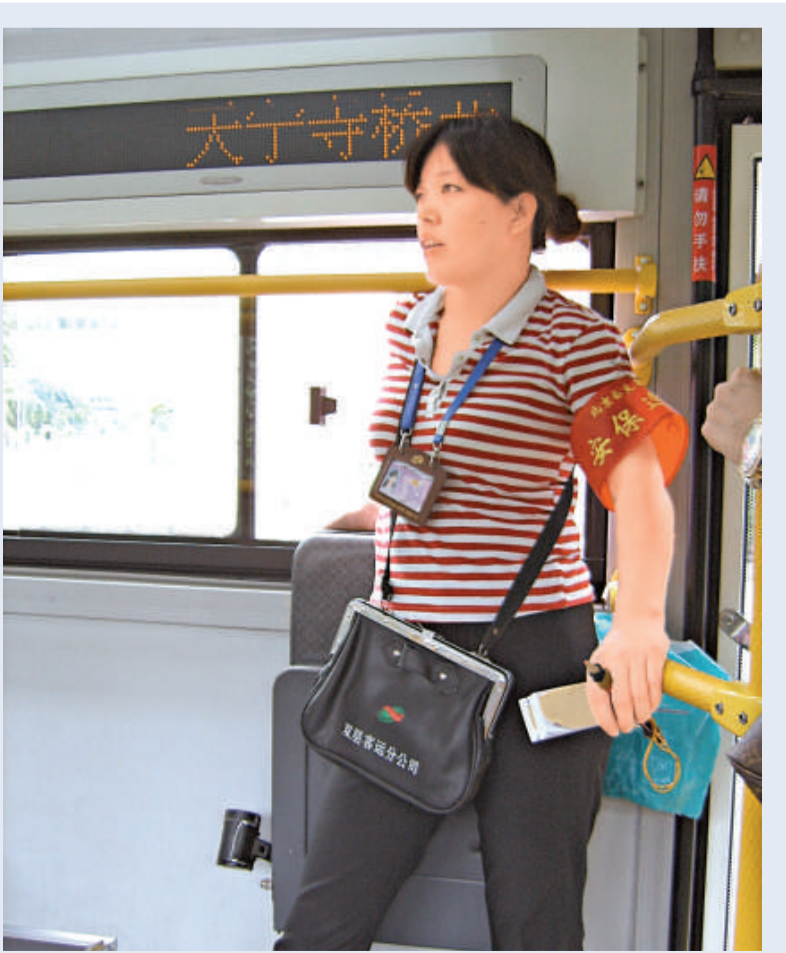
公共車上戴着「安保巡查」紅袖章的售票員

據悉，除了所有公交司售人員兼任安保巡查員外，奧運期間，北京公交集團還安置了2.5萬名公安巡檢員在公交站、車廂進行安全巡視檢查。其中1.5萬人在全市車站進行巡視安檢，另外1萬人配置在無人售票車以及無人售票車上，保證做到每班一人。據介紹，公交集團對安保人員進行安檢的要求是「逢包必問、可疑必查、違禁拒載、視情報警」。 【本報北京一日電】