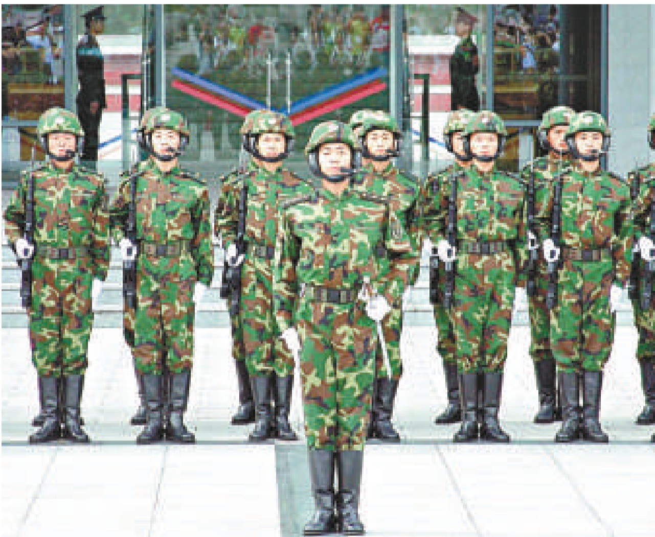
▲解放軍士兵列隊接受檢閱

有記者提出加強安保是否減少奧運的歡樂氣氛，田義祥表示，在籌辦過程中，中國就開始注意到，既要安全又要營造良好的節日氣氛。沒有安全就沒有北京奧運的成功，奧運安全是國家和賽事的需要，是奧運舉辦成功與否的標誌，解放軍會全力以赴做好這項工作。