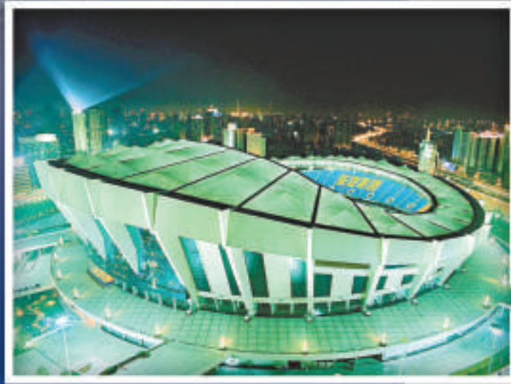
▲上海八萬人體育場外觀