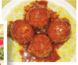
▲名饈紅燒獅子頭 ▲著名小吃糟田螺