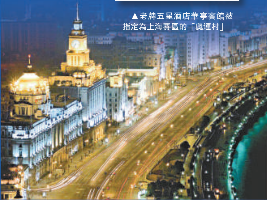
▲美麗夜上海華燈璀璨