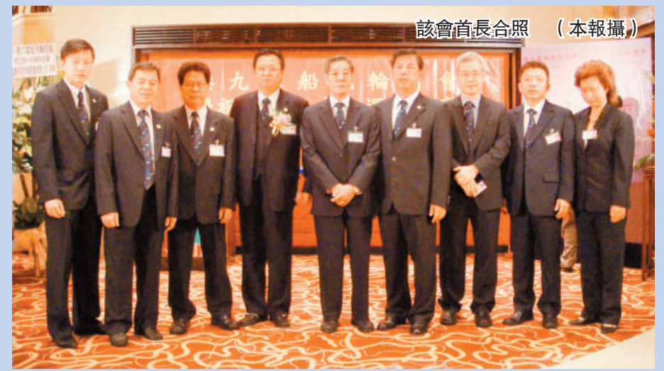
該會首長合照