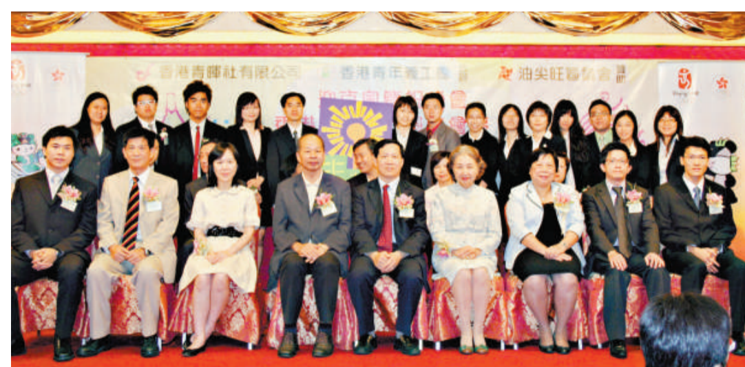
主禮嘉賓和新一屆執委合影留念

許多有益的工作。他說，再過幾天，舉世矚目的北京奧運將要開幕，在此預祝盛會圓滿成功。他還希望該會能繼續堅持服務社會、服務青年的宗旨，大膽探索，努力創新，與時並進，團結青年，為香港的繁榮穩定做出新貢獻。 大會並隆重舉行了頒發聘任書、選任書，以及宣誓的儀式，新一屆執委在各界賢達及友好的見證和祝福下正式就職。