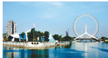
亞洲第一天津海河摩天輪

天津建築具有古建築、近代建築和現代建築並存的特色，有「萬國建築博物館」之稱。由於開埠較早，且有九國租借，以風格各異的小洋樓為特色，保留着19世紀末到20世紀初東西各國各類建築1000多幢。