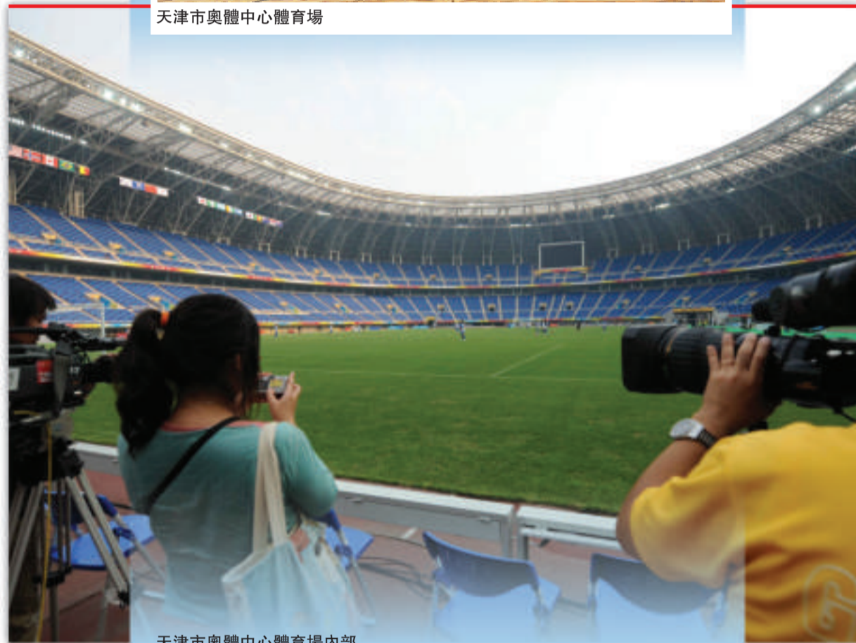
天津市奧體中心體育場內部