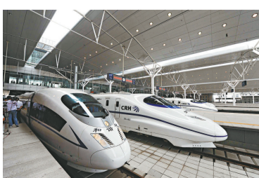
京津城際高速鐵路

天津交通十分方便，是津滬鐵路、津哈鐵路交匯點，經高速公路到北京僅1小時車程。京津城際軌道交通工程也於8月1日運營，沿途設北京南、亦莊、武清、天津等4座車站，預留永樂站。京津間全程直達運行時間控制在30分鐘內，列車最少行車間隔3分鐘。