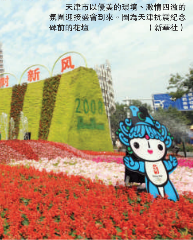
天津市以優美的環境、激情四溢的氛圍迎接盛會到來。圖為天津抗震紀念碑前的花壇