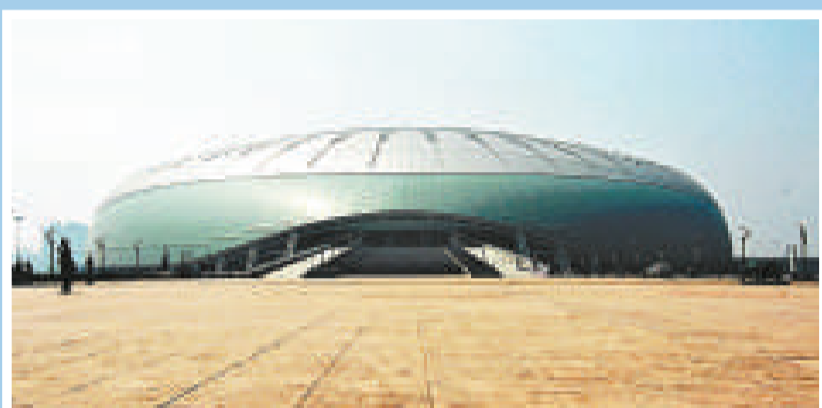
天津市奧體中心體育場