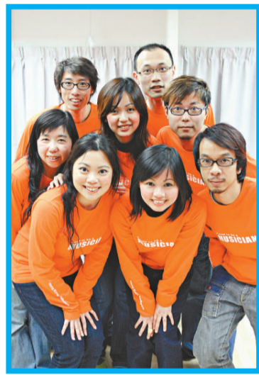
▲姬聲雅士用人聲與管弦樂競技

今年夏天，當香港某些樂團的成員可以乘著樂季結束，享受假期，甚或離港避暑，香港小交響樂團不單沒有外遊消暑的份兒，反而比平常更忙。樂團一方面要在七月中及八月下旬先後為英國皇家芭蕾舞團的《希爾薇姬》和《曼儂》以及香港芭蕾舞團的《夢情緣》伴奏，亦在七月底舉行了五嶋龍音樂會，以及在八月上旬舉行七場麥兜音樂會。由此可見，今年暑假「小交」真的忙得不可開交。