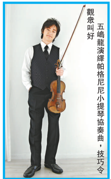
五嶋龍演奏帕格尼尼小提琴協奏曲，技巧令觀眾叫好