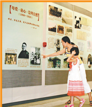
在第一展廳中向觀眾展示的「葉聖陶寫給巴金的信」