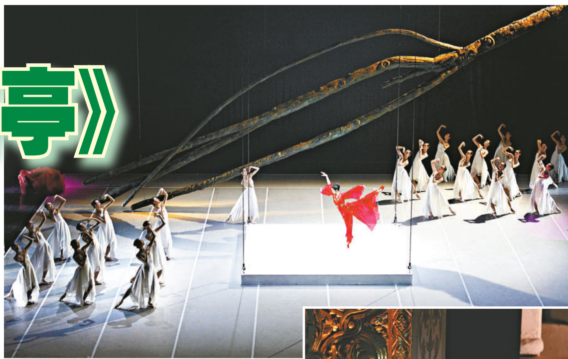
▲中芭芭蕾舞劇《牡丹亭》中，中間的「亭」會被吊上吊落