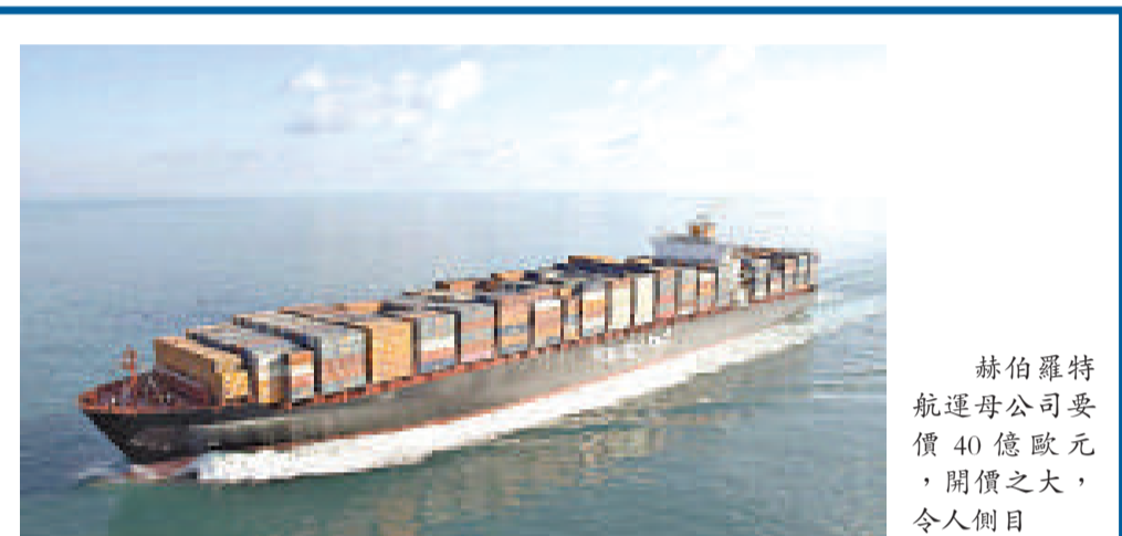
赫伯羅特航運公司要價 40 億歐元，開價之大，令人側目