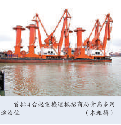
首批 4 台起重機運抵招商局青島多用途泊位

招商局青島公司位於青島前灣南港區，毗鄰保稅區，總投資額約 50 億人民幣，規劃總面積 2.65 平方公里，其中包括 1.65 平方公里的港區和 1 平方公里的保稅物流園區。目前地中海航運掛靠該碼頭。