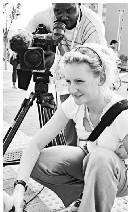
兩名採訪北京奧運會的英國記者七日在北京街頭採訪

隨各國元首正一團來華的衛隊、保鏢，也將參與從駐地到鳥巢的全程安保工作。他們將貼身保衛元首們的安排，不離不棄。其中，美國總統布什的保鏢陣仗最大，據稱多達六百多人。日本首相福田康夫的保鏢都是特警隊的隊員，都是劍道和空手道三段以上的高手。各國保鏢還被允許可以攜帶槍支彈藥、通訊器材。