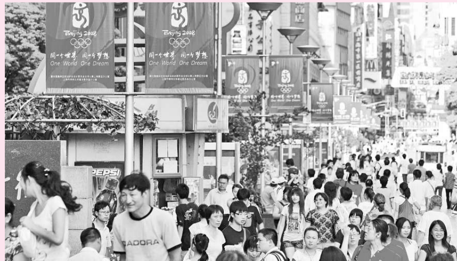
北京奧運會開幕在即，上海市街頭充滿各式各樣的奧運元素，讓市民感受到濃濃的奧運氣氛