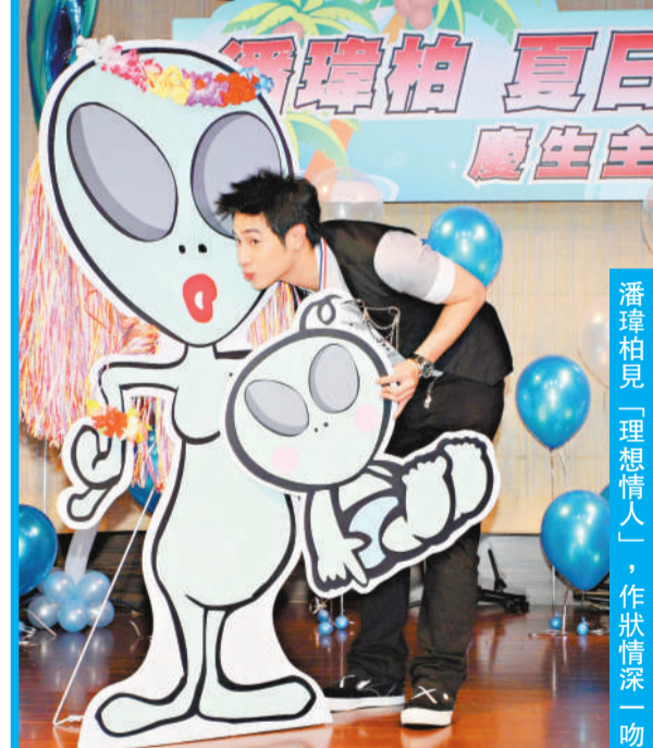
潘瑋柏見「理想情人」，作狀情深一吻

潘瑋柏忙裡偷閒與歌迷共聚，一起度過歌迷特別為他舉辦的慶生Party。當日歌迷上台獻上祝福，說出祝瑋柏28歲生日快樂的時候，瑋柏立刻告訴歌迷他是永遠的25歲。他還現場演唱歌曲回饋歌迷，演唱時還上台與每個歌迷近距離接觸握手，讓歌迷十分感動。 波霸蛋糕 適逢潘瑋柏精選專輯的宣傳期，上周還奪下唱片銷售的冠軍，歌迷見此特別訂做了桂冠與金牌送給瑋柏。除了歌迷的禮物之外，經理人公司也準備了波霸蛋糕送給瑋柏，讓瑋柏看了一陣臉紅，直呼這樣的禮物太驚人了，化成人應該會被嚇壞。至於生日願望，瑋柏希望自己所有專輯的總銷量可以突破一千萬，早日晉升千萬俱樂部。 似外星人 忙於工作連休息時間都不夠的潘瑋柏，經理人擔心瑋柏會找不到女朋友，特別針對瑋柏開出的女友條件(眼睛大還有長直髮)作了KUSO版的女友人型立牌作為禮物，沒想到揭幕一掀開，全場歌迷與媒體笑翻天，原來這個女友居然是個外星人的模樣，不僅如此，還幫瑋柏生了一個外星寶寶，瑋柏見到這位理想情人簡直嚇壞了。但瑋柏最後還是應歌迷要求拍了許多甜蜜的全家福的照片。 奧運即將開始，忙碌的瑋柏結束慶生會後將直接飛往北京，除了參加代言活動之外，瑋柏很希望在奧運期間能夠親自看到籃球比賽，因為瑋柏說這是難得一見的各國夢幻球隊的廝殺，每一場一定都很精彩。