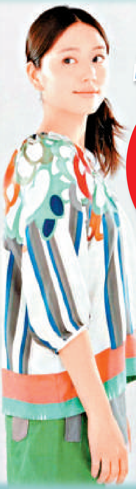
▲長澤正美青春可人，難怪戀情亦多姿多采