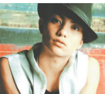
▼金載沅的微笑極具吸引力