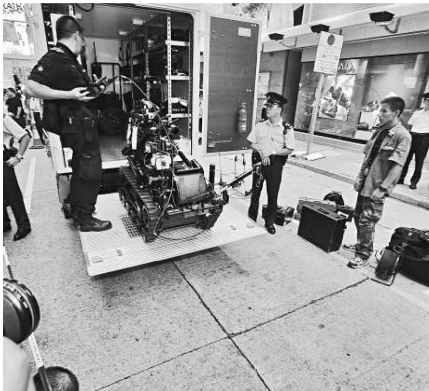
▲爆炸處理組人員運送拆彈機械人到銅鑼灣站 ▼拆彈機械人引爆可疑物體