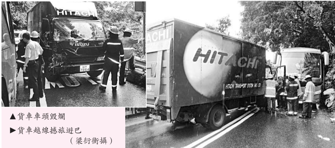
▲貨車車頭毀爛 ▲貨車越線撞旅遊巴士

有市民於昨日上午十一時三十六分行經香港仔瀑布灣道瀑布灣時，發現斜坡對下十多米的石灘樹叢有一具女屍，大驚報案。警方接報後為王×麗的屍體被水流沖至上址，即時派員在石灘拉起警戒線，禁止任何人接近，經初步驗屍相信不是死者王×麗。警方現場作問卷調查，有人曾在較早前目擊死者在附近拖狗散步，根據現場環境，疑失足跌落山坡傷重死亡，事件無可疑，其所牽的愛犬疑受驚走失，警方正設法聯絡死者家人。