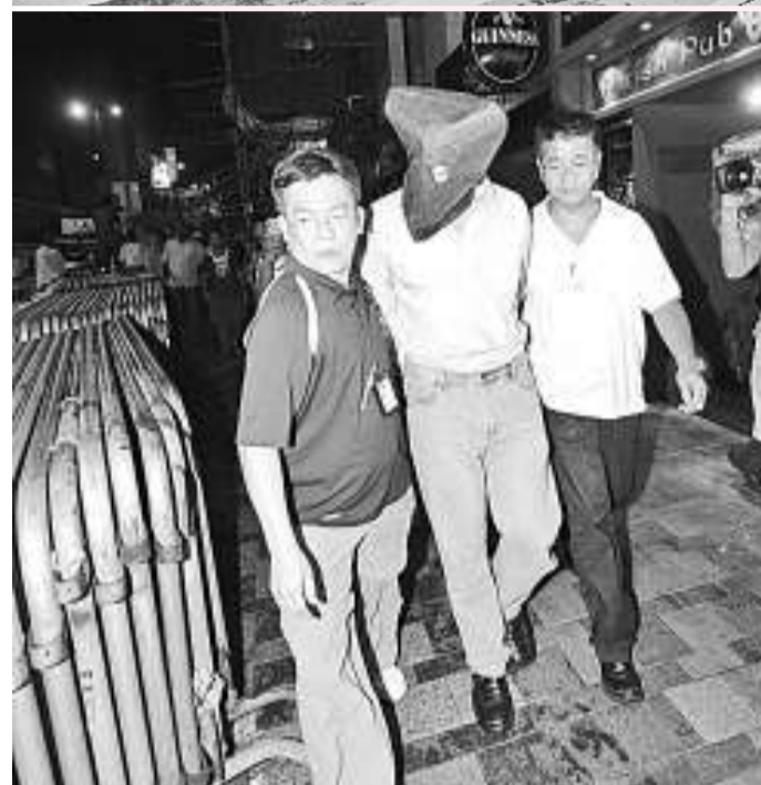
▲外籍男子被蒙頭押走