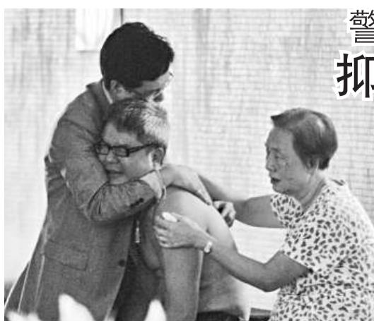
▲妻子跳樓亡，丈夫(中)痛哭

【本報訊】一名婦人疑因擔憂兩名幼子女養育問題抑鬱成疾，精神有異，昨日離開鯉魚涌康怡花園寓所後突然走上天台跳樓，飛墜地面傷重死亡。大廈天台有警鐘裝置，提醒保安員有人闖進，惜事發時故障待修，未能防止悲劇發生。