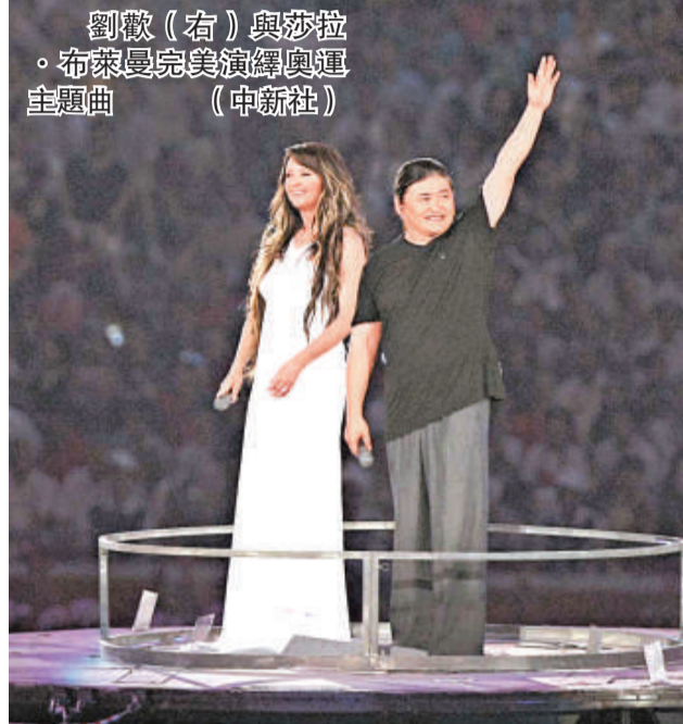
劉歡(右)與莎拉·布萊曼完美演繹奧運會主題曲