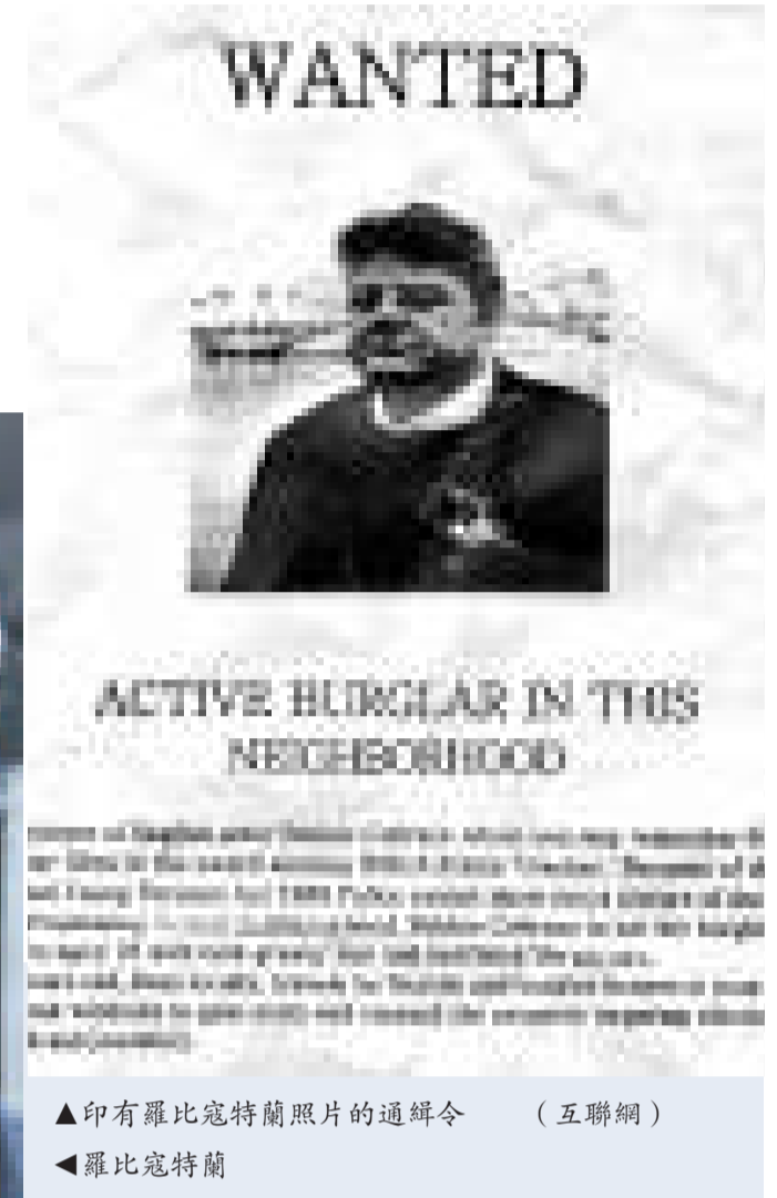
▲印有羅比寇特蘭照片的通緝令 ◀羅比寇特蘭