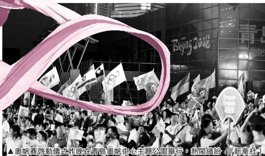
▲奧帆賽啓動儀式昨晚在青島奧帆中心主題公園舉行，熱鬧繽紛