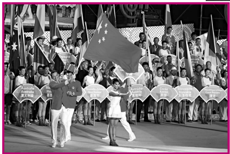
▲中國帆船隊在奧帆啓動儀式上入場

今日晚8時，天公作美，美麗的青島海風習習，千帆待發。在絢爛的煙花中，第29屆奧林匹克運動會帆船比賽啓動儀式在浮山灣奧帆中心主題公園舉行，1996年奧運會風帆冠軍、香港運動員李麗珊乘坐空中帆船點燃了青島城市慶典火炬。