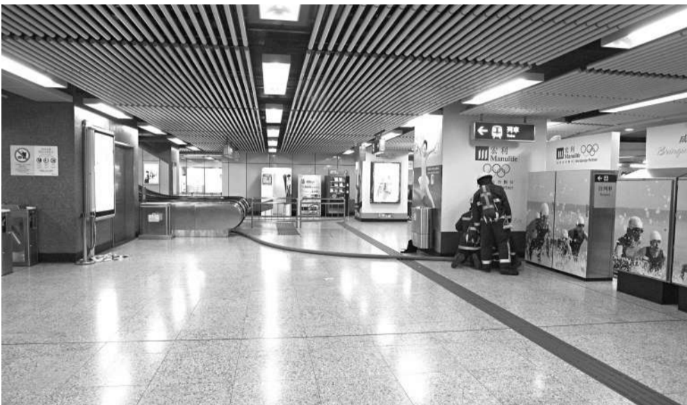
▲警方前晚在銅鑼灣地鐵站引爆可疑物體 (資料圖片)

由於海上求救煙火彈在本港屬受管制物品，擁有或使用者以貨船、遊艇的水手或參與海上活動的運動員為主，警方會重組該彈的外層包裝外貌，確定品牌種類，尋找本港是否有代理和發售，追蹤可疑買家。另一方面，亦會從纏著煙火彈的膠紙入手，追尋是否有指紋的線索。同時翻看港鐵站內和附近店舖的閉路電視錄影帶，希望能找到放置煙火彈狂徒。