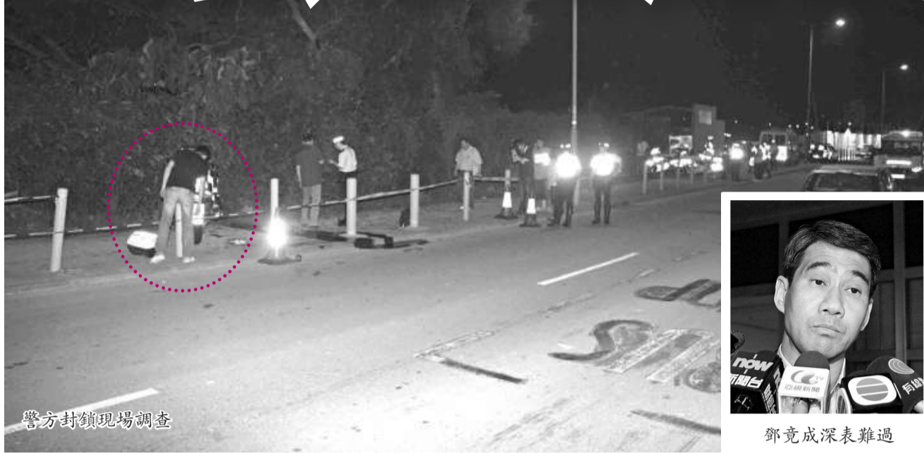
警方封鎖現場調查