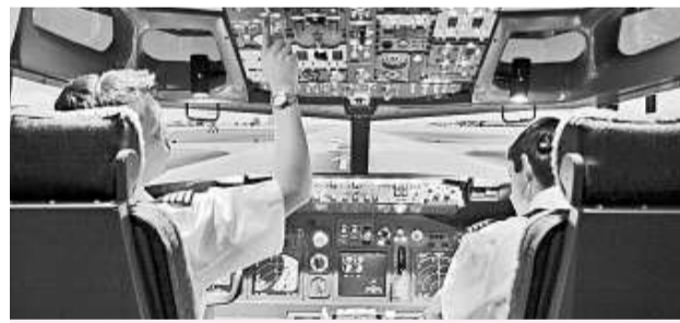
飛行體驗將於下月在香港開張，花費二千元即可在模擬機艙內，體驗空中飛行的刺激與樂趣

【本報訊】實習記者李紹儀報道：翱翔空中是不少人的夢想，成為一名飛機駕駛員更是飛行愛好者們夢寐以求的職業。國際知名商戶「飛行體驗」即將落戶香港，開設全球唯一同時擁有兩個飛行模擬器的旗艦店，二千元即可體驗空中飛行的刺激與樂趣。東九龍 MegaBox 商場昨日宣布，「飛行體驗」將首次進駐香港，並正式加盟 MegaBox。