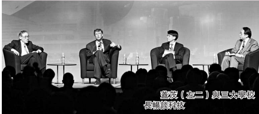
蓋茨(左二)與三六大學校長暢談科技

微軟亞洲研究院迎來十周年慶典，昨晚在會展舉行創新論壇。比爾·蓋茨專程來港，並發表以「開展下一個十年的創新」為主題的演講。對於未來科技的創新發展，蓋茨抱持非常樂觀的態度。他表示，互動科技將成為未來創新的重點之一。