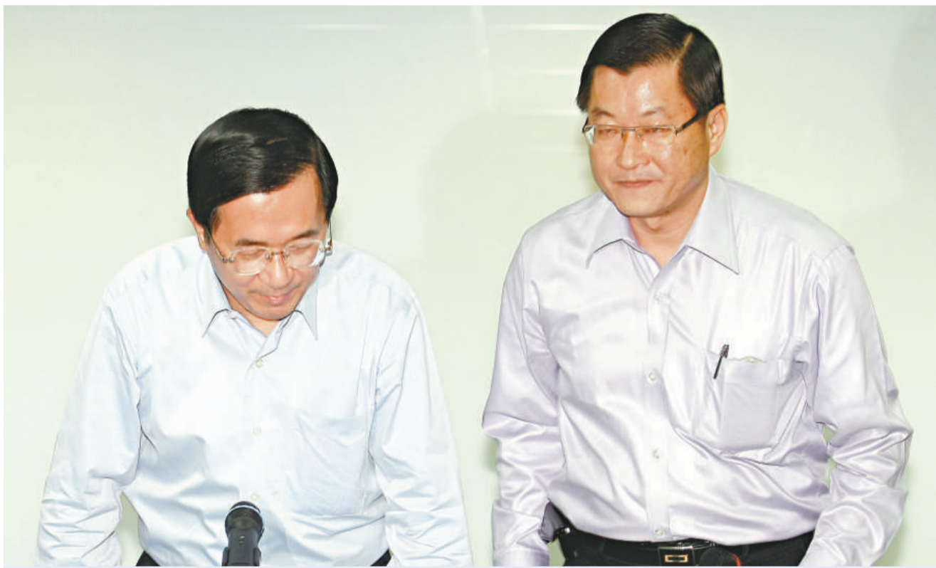
陳水扁(左)召開記者會，承認從台北市長到「總統大選」的四次選舉中，不實申報競選經費

陳水扁還質疑這次馬蕭競選只花費六億七千萬(新台幣，下同)，有短報之嫌，過去連宋、蕭蕭競選經費也是如此。