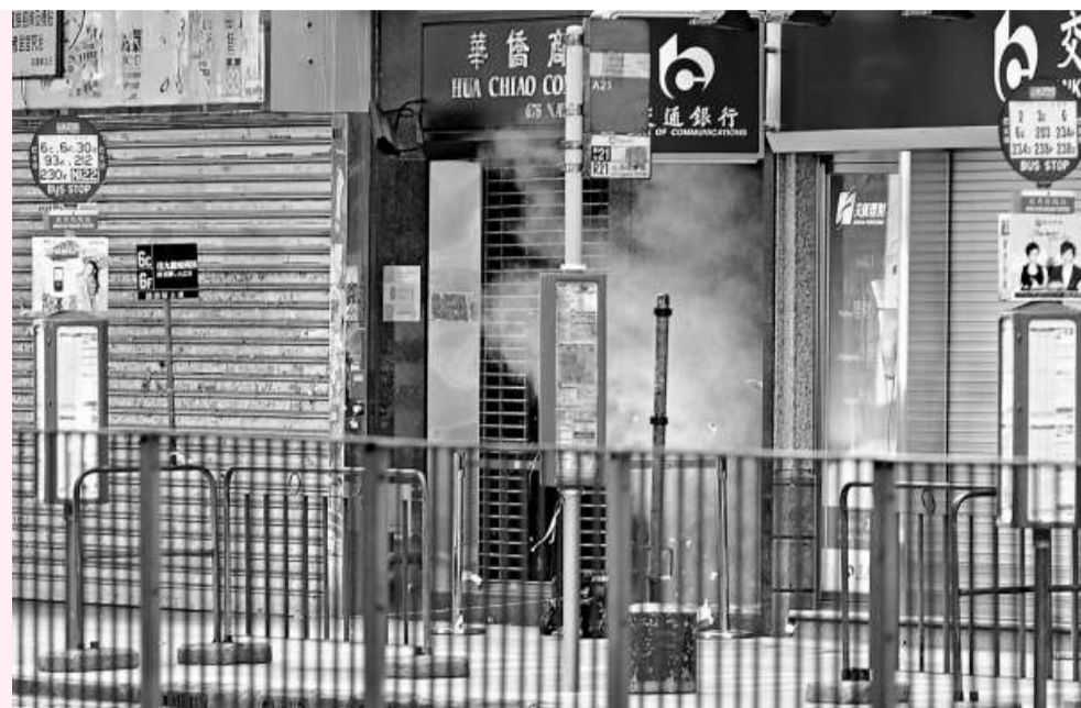
▲引爆在旺角發現的可疑物品