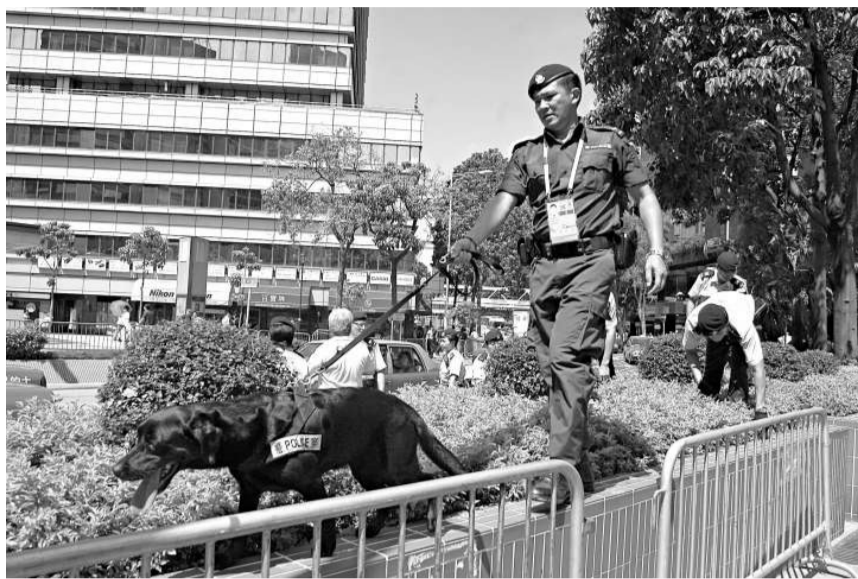
▲爆炸品搜索犬在尖東酒店附近搜索

接連的可疑物品事件，警方加強街頭巡查警員及截查可疑人，在彌敦道解封不久，有警員在荔枝角道截查可疑人時遇到反抗襲擊，警員面部受傷仍奮力與疑人糾纏。大隊警員接報趕至，合力將三十餘歲疑人制服，受傷警員事後送院救療。