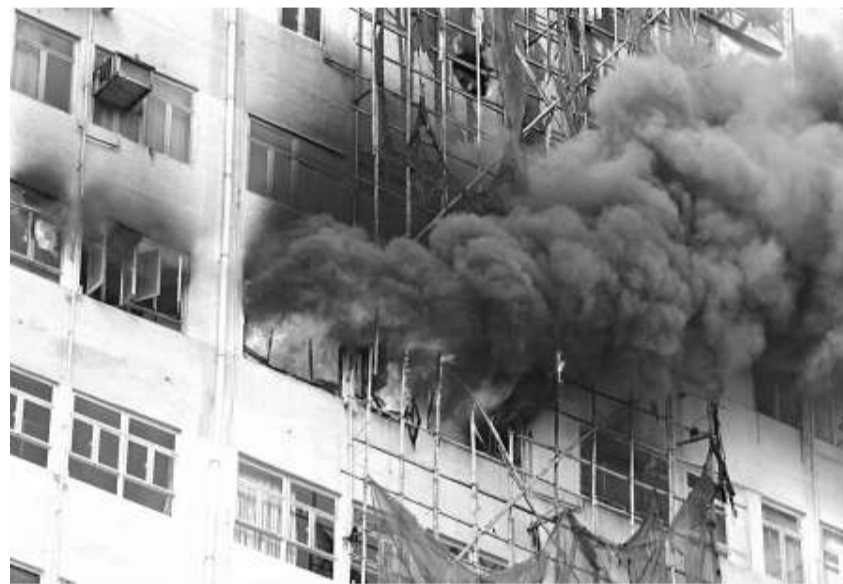
▲禾宜合道三級火現場冒出濃煙

由於火場儲存有易燃物品，大火焚燒多個小時後仍未受控制。消防處共動用六條消防喉及七隊煙帽隊撲火，現場消息稱，火警發生時曾有工人在竹棚燒焊，疑有火屑濺入單位引起大火；亦有人指缺德者在高處拋煙蒂，跌入有關單位惹禍。