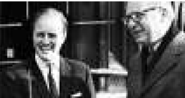
「警察」樂隊鼓手斯圖爾特·科普蘭的父親邁爾斯·科普蘭(右)與英國前首相丘吉爾的孫子小溫斯頓·丘吉爾的合影

【本報訊】據《泰晤士報》十四日報道，作為美國中央情報局(CIA)前身的戰略情報局(OSS)，其所屬的二萬四千名間諜的工作和身份，即將由美國國家檔案局解密，一個龐大的軍方與民間特務網絡將公諸於世。