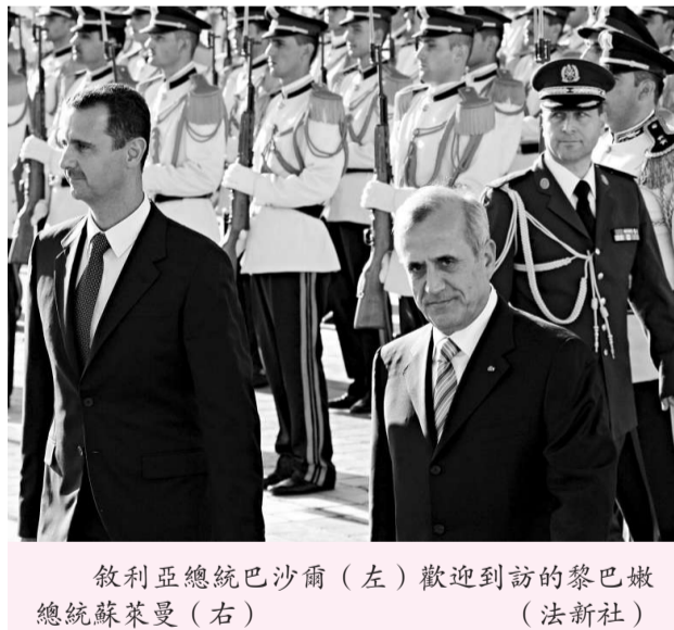
敘利亞總統巴沙爾(左)歡迎到訪的黎巴嫩總統蘇萊曼(右)

敘利亞和黎巴嫩在第一次世界大戰後淪為法國委任統治地。由於敘一直視黎為自己的屬地，不承認其獨立地位，故兩國雖然於上世紀四十年代先後宣布獨立，卻一直沒有建交。一九七六年，經阿拉伯聯盟授權，敘以「阿拉伯威懾部隊」名義派數萬名本國士兵進駐黎巴嫩，對黎實施軍事、政治等全面控制。直到二〇〇五年二月黎前總理哈里里遇害身亡，敘迫於國際壓力結束了在黎長達二十九年的軍事存在，此後兩國關係一直緊張。