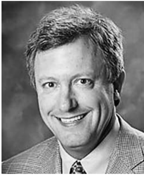
阿肯色民主黨主席格瓦特尼遭人開槍打死，引起各界震驚