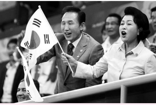
李明博和夫人在北京奧運會上為韓國健兒打氣

【本報訊】據韓聯社首爾十四日消息：韓國一項民意調查顯示，總統李明博數月來因「美國牛肉風波」而支持率急跌，但韓國選手在北京奧運會的出色表現，成功轉移了民衆