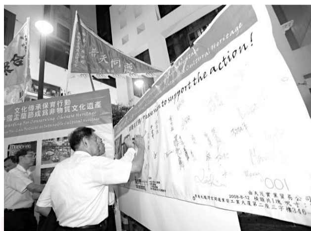
民建聯爭取孟蘭節為非物質文化遺產

在一片加價熱潮下，市民都利用各種方法以減少開支，據調查結果顯示，市民會以價格較低的急凍食品代替新鮮食品，並縮減在非必要的食品上的開支，在選擇副食品時，選擇較便宜的替代品。縱使市民盡量精明地消費，但食品和雜貨的消費額仍較去年多百分之六。