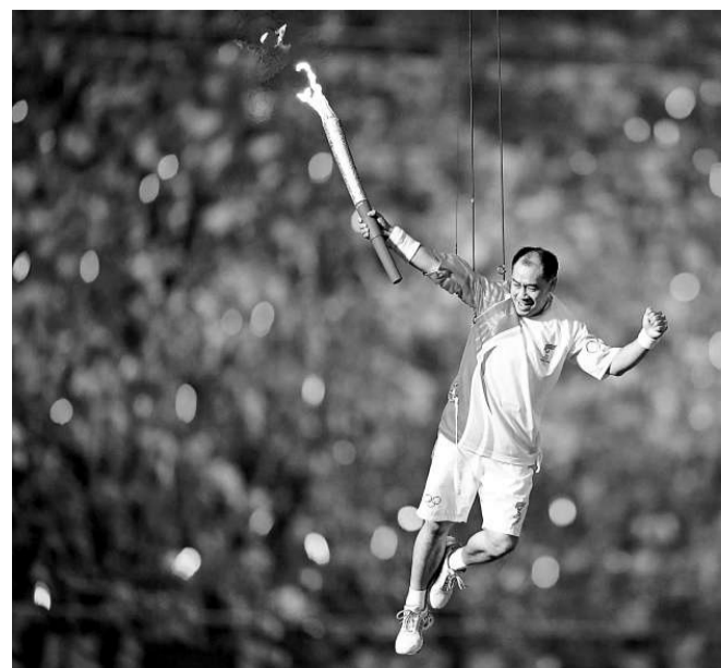
李寧移居香港。在京奧開幕式上的「追日」點燃聖火令人嘆為觀止

一九八四年洛杉磯奧運會上，李寧一舉奪得自由體操、鞍馬和吊環三枚金牌，前後奪得十四個世界冠軍，成為史上擁有最多世界冠軍的體操選手，紀錄一直無人打破，直至本月十二日奧運會上，才被李小鵬的十五個世界冠軍超越。