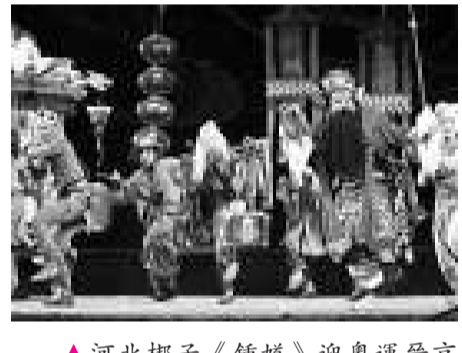
▲河北梆子《鍾馗》迎奧運晉京演出