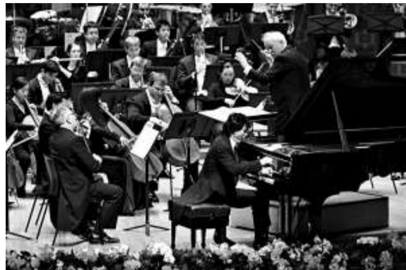
李雲迪曾與港樂奏蕭羅哥非夫的協奏曲，獲得好評