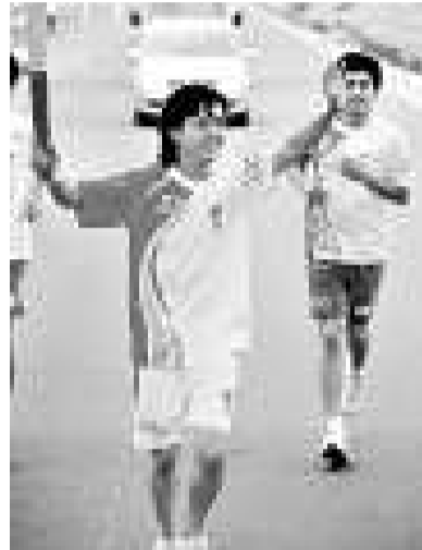
▲李雲迪傳遞奧運火炬