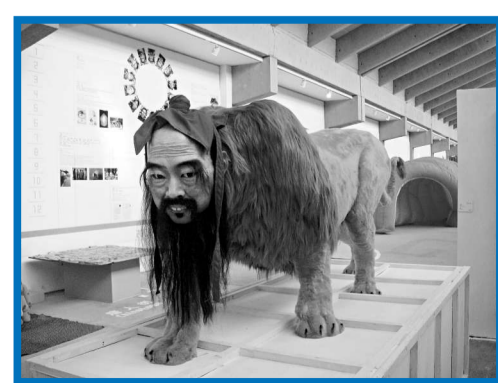
▲岳路平作品《嗓子》